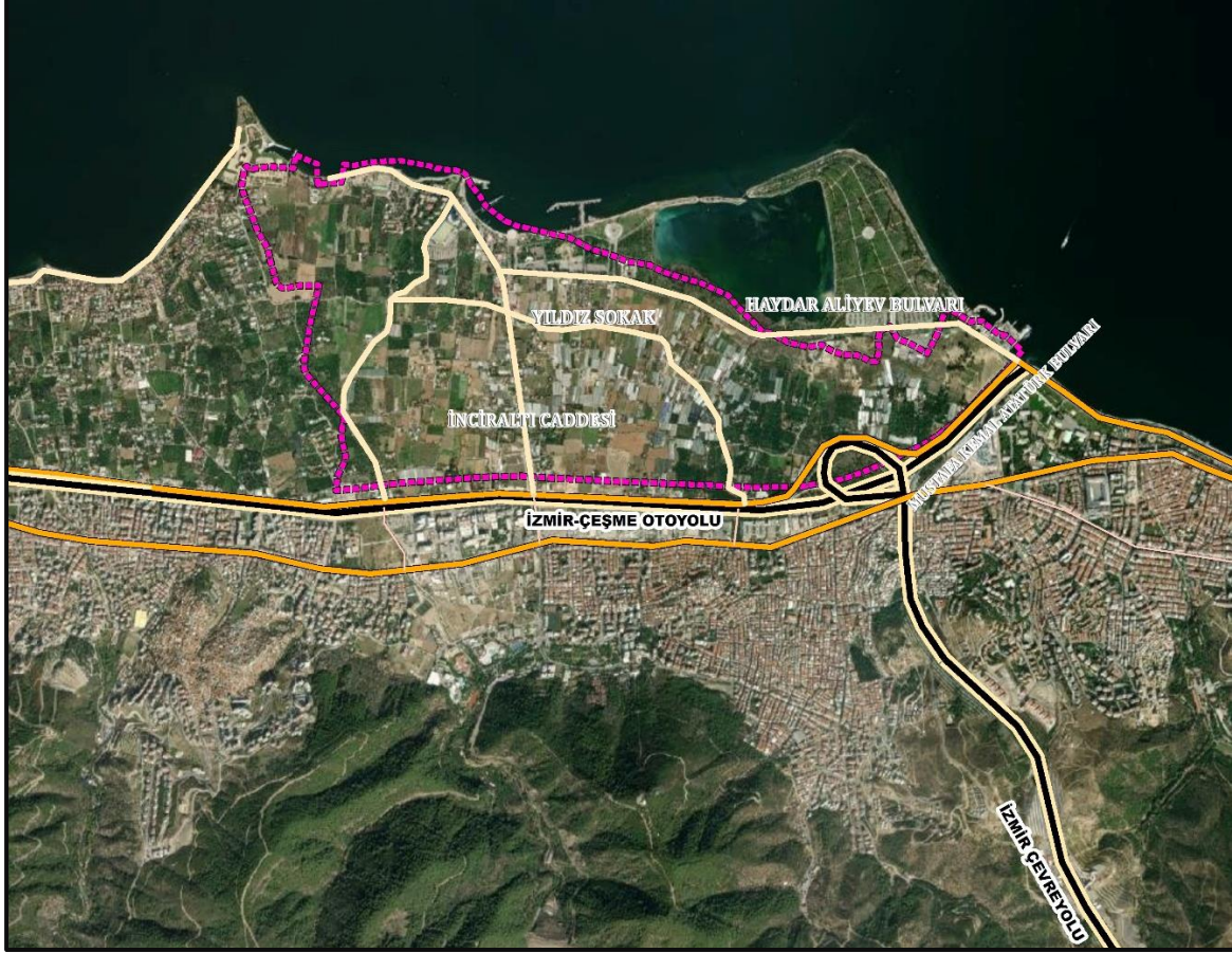
Şekil 3. Planlama Alanı ve Çevresi Ulaşım Bağlantıları

Balçova İlçesi'nde bulunan Üçkuyular Vapur İskelesi kent içi ulaşımının sağlandığı önemli bir araba ve yolcu vapur iskelesidir.