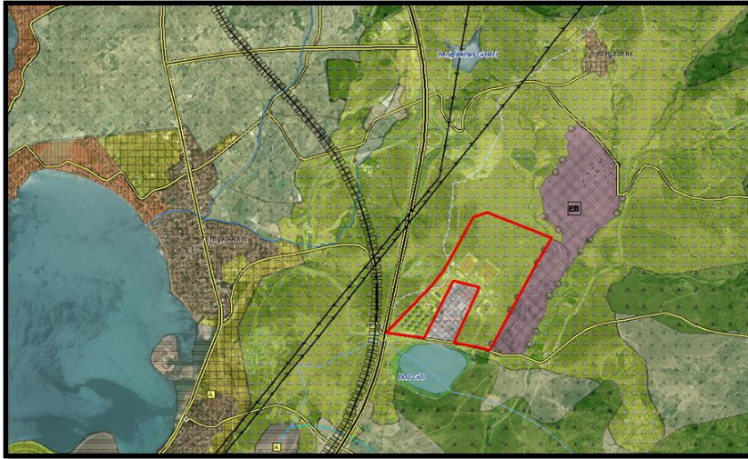
Şekil-1: Planlama konusu alanın onaylı İzmir-Manisa Planlama Bölgesi 1/100.000 Ölçekli Çevre Düzeni Planındaki konumu