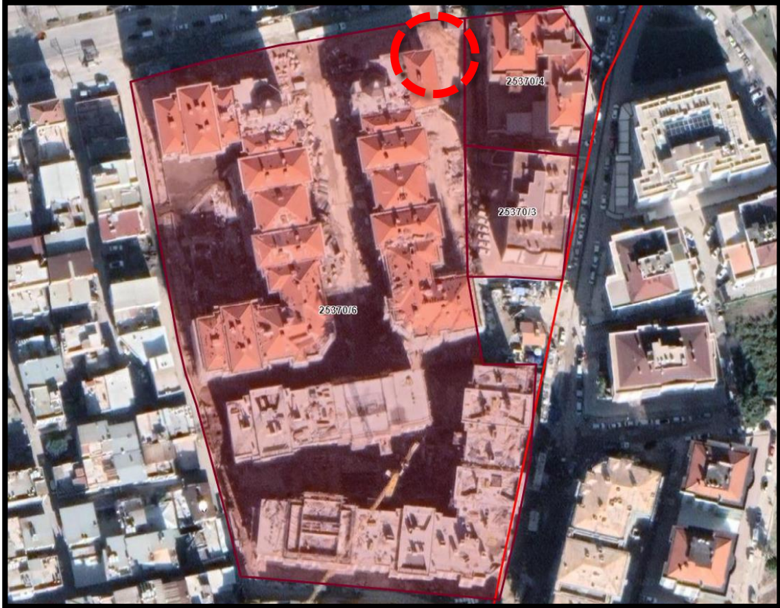
Harita 3: Mülkiyet Durumu

Planlanan trafo alanı 25279 ada 1 parselin doğusunda, 25220 adanın güneyinde kamuya terkli alanda yer almaktadır. Trafo alanının çevresinde uygulama görmüş parseller bulunmaktadır.