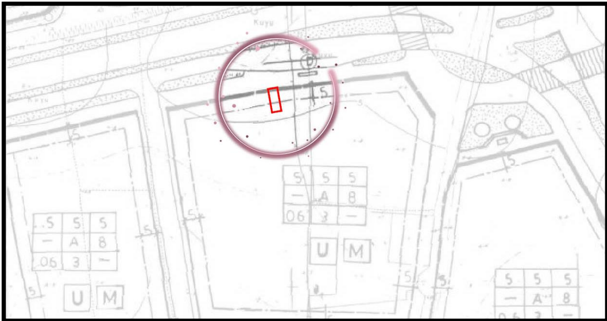
Harita 7: Trafo Alanının Mevcut 1/1000 ölçekli Uygulama İmar Planındaki Durumu

Planlama alanı 3194 Sayılı İmar Kanununun 9. Maddesi ve 1 No.lu Cumhurbaşkanlığı Kararnamesi ile 6306 sayılı Afet Riski Altındaki Alanların Dönüştürülmesi Hakkındaki Kanunun ilgili hükümleri çerçevesinde 07.05.2021 tarihinde onaylanan 1/1000 ölçekli Uygulama İmar Planında "Konut Alanı" kullanımında kalmaktadır.