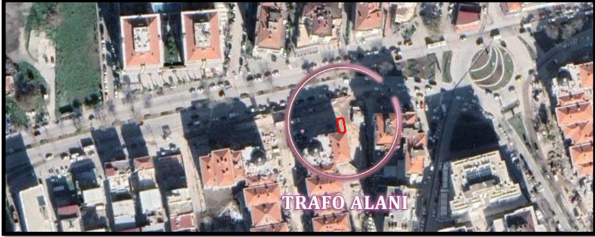
Harita 1: Planlama Alanı Uydu Görüntüsü

Planlamaya konu trafo alanı; İzmir kent merkezinin (Konak) kuzeydoğusunda Bakanlık Makamının 30.11.2020 tarihli ve 256261-256267-256269-256273-256278-256281-256285 sayılı Olur'ları ile onaylanan 3 nolu rezerv yapı alanı sınırları içinde Bayraklı İlçesi, Salhane Mahallesi 25370 ada 6 parsel üzerinde yer almaktadır.