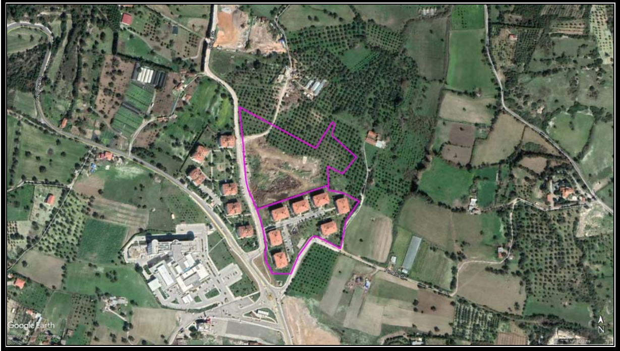
Şekil 2: Planlama Alanı Uydu Görüntüsü

İzmir ilinin tamamı, Türkiye Deprem Tehlike Haritasında Yüksek Tehlikeli Bölgede yer almaktadır.