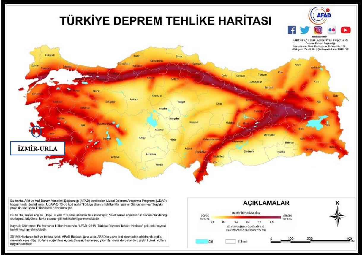
Şekil 3: Deprem Tehlike Haritası

İzmir ilinin tamamı, Türkiye Deprem Tehlike Haritasında Yüksek Tehlikeli Bölgede yer almaktadır.