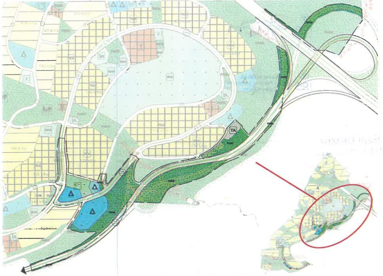
Şekil 4 Nazım İmar Planı Değişikliği (II)

Söz konusu plan değişikliğine konu alanlardan bir diğeri planlama alanının güneydoğusundaki Taşıt Yollarının genişliklerinin ve kurgusunun değişmesi sonucu Eğitim, Spor, Teknik Altyapı ve Park alanlarındaki değişimdir. Yol genişliğinin ve kurgusunun değişmesi sonucu fonksiyon alanları büyüklükleri yüksek oranda korunacak şekilde düzenleme yapılmış ve donatı tahsis dengesi korunmuştur.