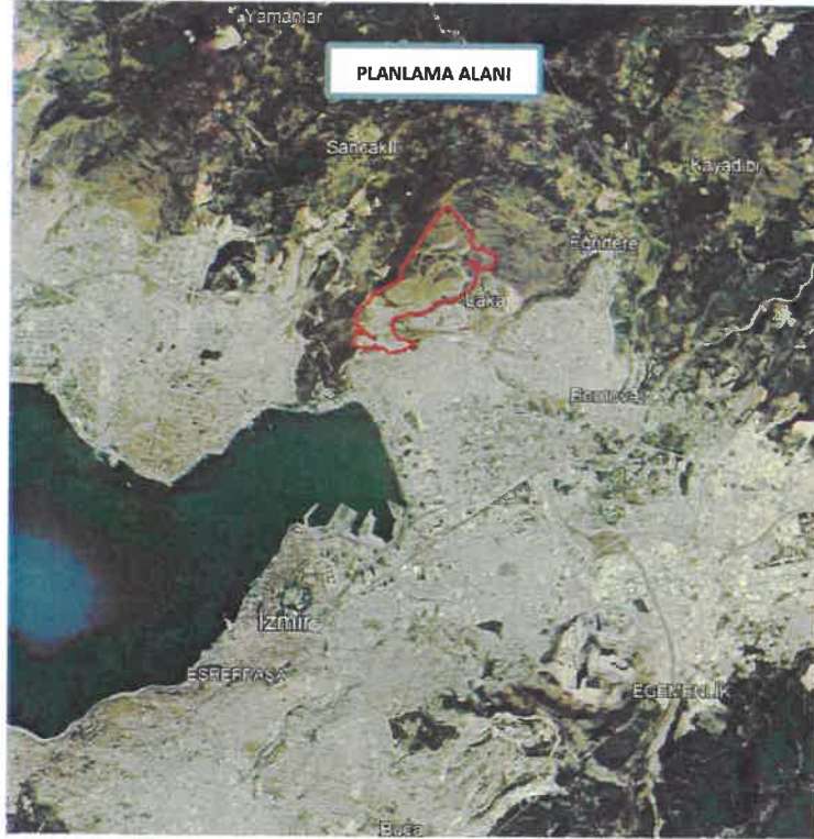
Şekil 1 Planlama Alanının Konumu

Rezerv yapı alanı sınırları içerisinde 19.08.2021 tarihinde onaylanan planlar kapsamında proje uygulamaları devam etmekte olup gelinen aşamada rezerv yapı alanında; Karayolları Genel Müdürlüğü 2. Bölge Müdürlüğü'nün "İzmir Kuzey-Doğu Çevre Otoyolu üzerindeki Laka Kavşağı Projesi" ve yerinde Genel Altyapı İhalesi kapsamında yapımı tamamlanmış trafo alanları ve yol bağlantılarına ilişkin onaylı planda kısmi revizyonlar yapılması gerektiğinden plan değişikliğine ihtiyaç duyulmuştur. Bu doğrultuda onaylı imar planlarında birtakım geometrik ve ulaşım sistemi açısından düzenlemeler yapılmıştır.