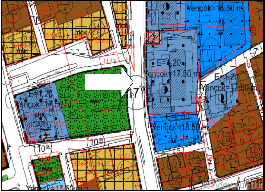
1/1000 Uygulama imar planı