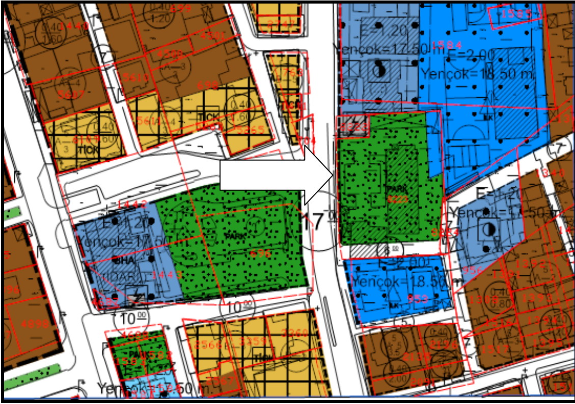
Öneri 1/1000 İlave ve Revizyon Uygulama İmar Planı