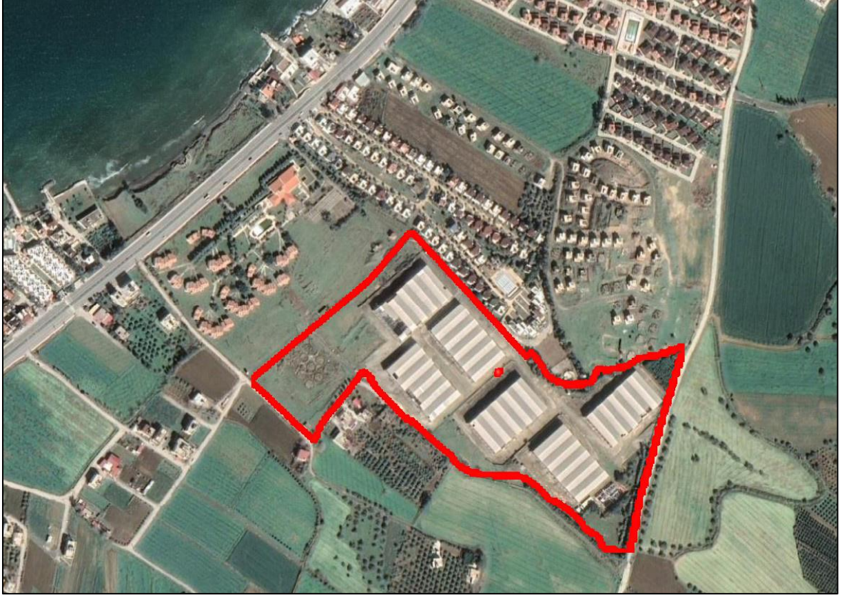
Şekil 3. Planlama Alanı Uydu Görüntüsü

Planlama alanı 1994 ada 1 ve 2 parselleri kapsamakta olup toplam alan büyüklüğü yaklaşık 10 hektardır. Hâlihazırda 1994 ada 1 parselde 6 adet prefabrik depo, bir adet prefabrik sosyal tesis, 12 adet tank yapısı bulunmaktadır. Ayrıca, 1994 ada 2 parsel tapu kaydında pilon yeri olarak belirtilmiş, ancak mevcutta yer almamaktadır. Planlama alanının çevresinde yazlık konutlar ve tarım alanları yer almaktadır.