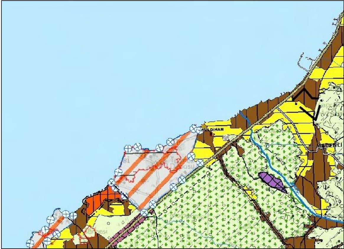
Şekil 7. Öneri 1/100.000 Ölçekli Çevre Düzeni Planı Değişikliği

Plan üzerinde belirtilmeyen hususlarda onaylı çevre düzeni planı kararları geçerlidir.