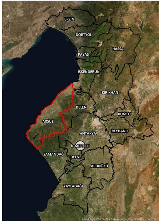
Şekil 2. Planlama Alanı İl İçerisindeki Konumu

Arsuz ilçesi, Hatay iline 90 km uzaklıkta, İskenderun'dan 40 kilometre boyunca güneyde sahil şeridi üzerinde ve merkezi Arsuz Çayı ağzında bulunan turistik bir ilçedir. Arsuz ilçesi toplamda 38 mahalleden oluşmakta olup plan değişikliğine konu alan ilçe merkezinin kuzeyine 15 km mesafede olan Maden Mahallesi sınırları içerisinde bulunmaktadır.