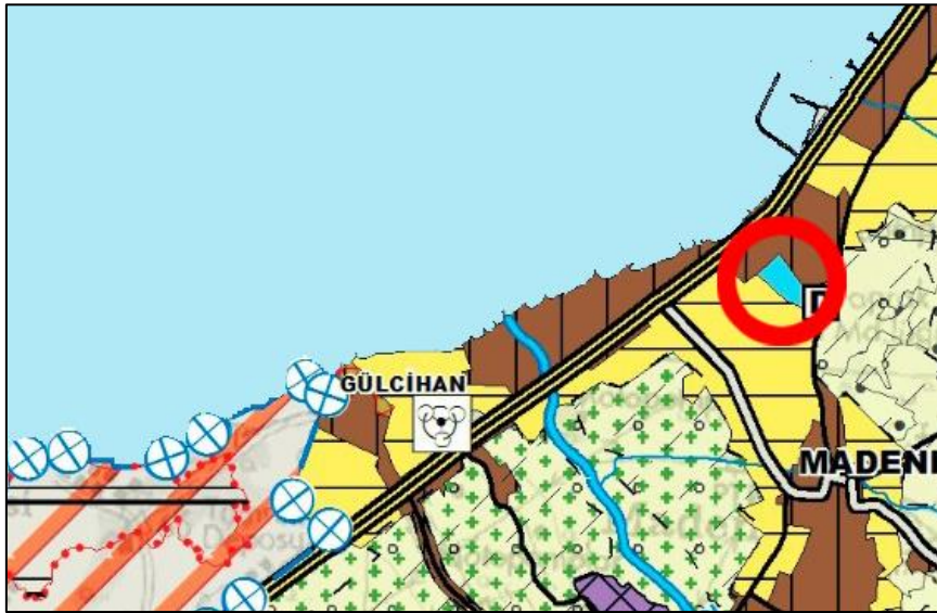
Şekil 6. Hatay İli 1/100.000 Ölçekli Çevre Düzeni Planı

Hatay ili 1/100.000 ölçekli Çevre Düzeni Planı, Hatay Büyükşehir Belediye Meclisi'nin 09.08.2018 tarih ve 253 sayılı Kararı gereğince onaylanmıştır. Planlama alanı, 1/100.000 Ölçekli P35 paftasında kentsel meskûn (yerleşik) alan, kentsel gelişme alanı ile kentsel ve bölgesel sosyal altyapı alanında kalmaktadır.