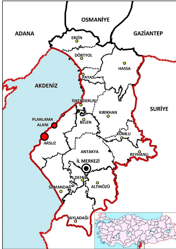
Şekil 4. Hatay İlçe Sınırları

Günümüzde Hatay; Antakya, Altınözü, Arsuз, Belen, Defne, Dört Yol, Erzin, Hassa, İskenderun, Kırıkhan, Kumlu, Payas, Reyhanlı, Samandağ ve Yayladağı ilçeleri olmak üzere toplam 15 ilçeden oluşmaktadır.