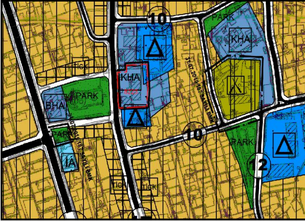
1/5000 Revizyon Nazım İmar planı