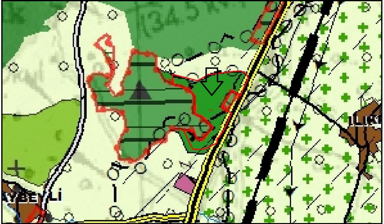
Planlama Alanının 1/100.000 ölçekli Hatay Çevre Düzeni Planındaki Konumu

Planlama alanına ilişkin onaylı 1/5000 ölçekli Nazım İmar Planı ve 1/1000 ölçekli Uygulama İmar Planı bulunmamaktadır. 1/100.000 ölçekli Hatay Çevre Düzeni Planında ise planlama alanı “KENTSEL VE BÖLGESEL YEŞİL VE SPOR ALANI” olarak planlıdır.