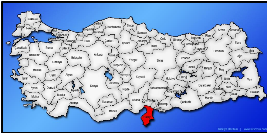
Şekil 1. Hatay ilinin Ülke İçerisindeki Konumu

Hatay ili Antakya ilçesinde bulunan planlama alanı, ilçe merkezinin batı bölümünde yer alan Çekmece mahallesi yer almakta olup, ilçenin kuzeybatı-güneydoğu aksında ana ulaşım bağlantılarından Cumhuriyet Caddesi ile Adnan Menderes Caddesi ve Süleymanşah Caddesi arasında kalan bölgede bulunmaktadır. Belirtilen caddeler ile 10 m taşıt yolu ve 7 m yayayolu bağlantıları mevcut olup, Merkez ile ulaşım bu caddeler üzerinden sağlanmaktadır. Bu yönüyle ulaşım imkanlarının yüksek olduğu bir bölgede konumlanan planlama alanı kent merkezine yaklaşık 1 km mesafede bulunmaktadır. Taşınmazın yakın çevresinde bulunan yapıların fonksiyon yönelimleri ise genelde konut ve konut alanlarına hizmet edecek sosyal altyapı alanları bulunmaktadır.