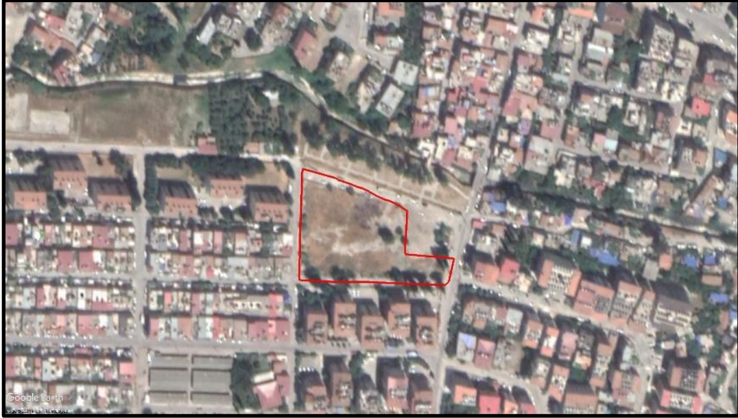
Şekil 3. İmar Planı Değişikliğine Konu Alana Ait Yakın Uydu Görüntüsü