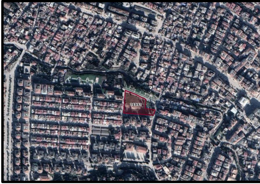
Şekil 4. Planlama Alanına Ait Kadastro Haritası