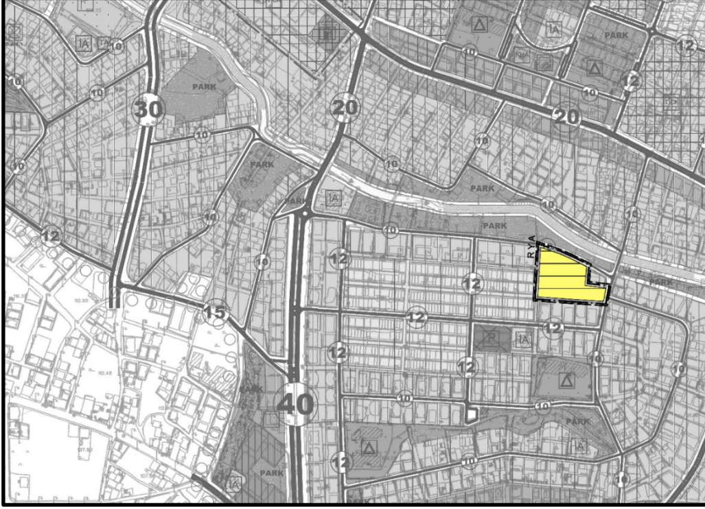
Şekil 6. 1/5000 Ölçekli Nazım İmar Plan Değişikliği

Daha önce de değinildiği gibi, plan değişikliğine konu alan 1/5000 ölçekli nazım imar planında “Konut Alanı” iken, 10.03.2017 tarih ve 73 sayılı Hatay Büyükşehir Belediyesi meclis karar ile kesinleşen 1/5000 ölçekli Nazım imar planına uygun olarak hazırlanan, 11.10.2017 tarih ve 96 sayılı Antakya Belediye meclis karar ile kabul edilen ve 23.11.2017 tarih ve 345 sayılı Hatay Büyükşehir Belediyesinin meclis karar ile onaylanan plan değişikliği ile Resmi Kurum Alanı (Emniyet Hizmet Alanı) olarak belirlenmiş olmasına karşın, Emniyet Genel Müdürlüğü’nün 16911 parsel üzerinde herhangi bir tasarrufu ve ihtiyacı bulunmamasından dolayı, alana ilişkin ilk plan durumunu olan konut alanı kullanımına geri dönüştürülmesi ihtiyacı hasıl olmuştur. Dolayısıyla, plan değişikliği ile alana ilişkin bütüncül planla önerilen plan kararı ve yoğunluğuna geri dönülmüş olup plana konusu alanda yeni kalıcı nüfus önerilmemiştir.