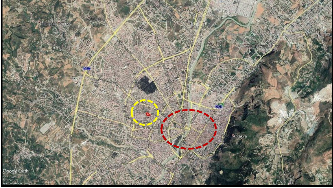
Şekil 2. Plan Değişikliğine Konu Alanın Kent İçerisindeki Konumu

Planlama alanı Hatay ili, Antakya ilçesi, Çekmece mahallesi sınırları içerisinde yer alan 16991 parseli kapsamaktadır. Ayrıca alan, UTM-3° projeksiyon ve ITRF96 datumunda tanımlanmış koordinat sisteminde Y:513216.976 ve X:4008514.159 yaklaşık koordinatları plan değişikliğine konu alanın merkezini göstermektedir. Planlama alanı ülke pafta indeksinde P36-D-03-C-3-B paftasında yer almaktadır.