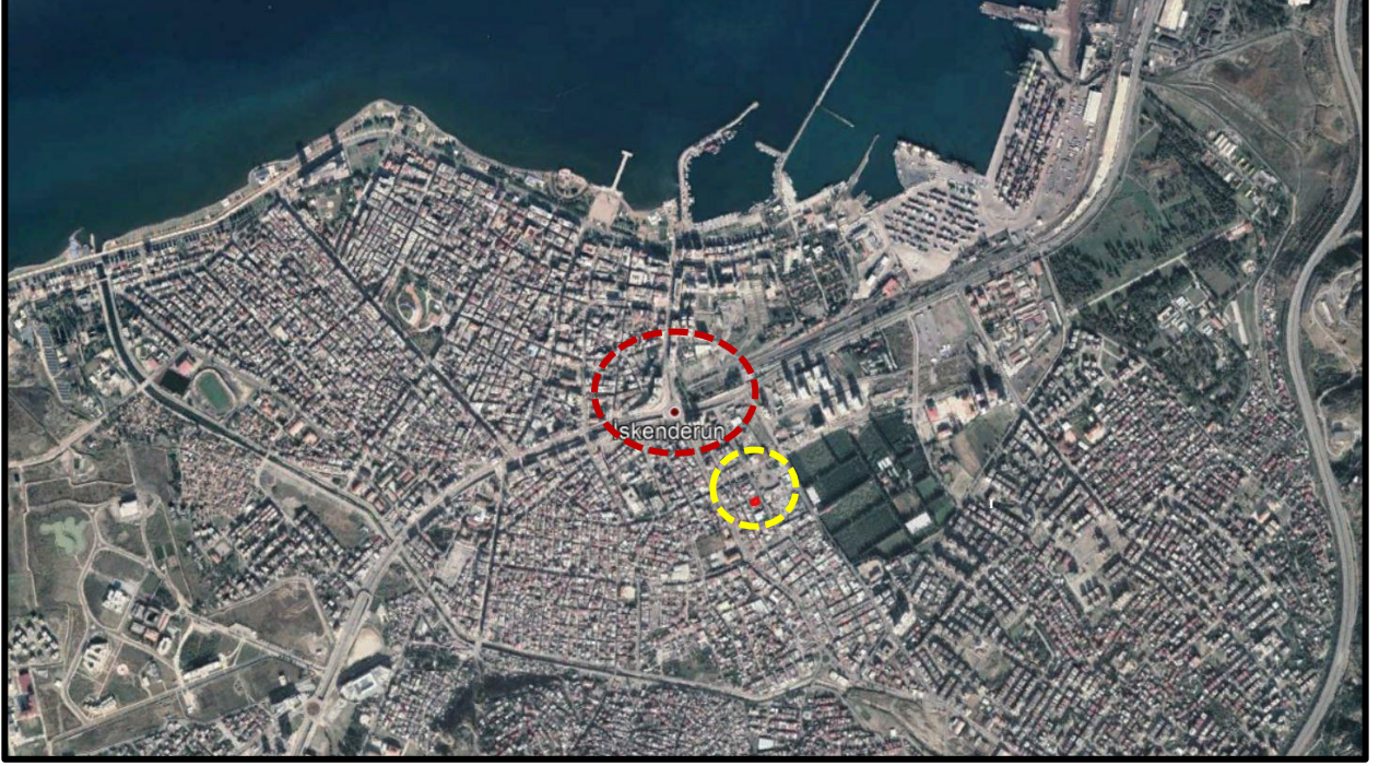
Şekil 2. Plan Değişikliğine Konu Alanın Kent İçerisindeki Konumu

Planlama alanı Hatay ili, İskenderun ilçesi, Aşkarbeyli Mahallesi sınırları içerisinde yer alan 2993 ada 3 parseli kapsamaktadır. Ayrıca alan, UTM-3° projeksiyon ve ITRF96 datumunda tanımlanmış koordinat sisteminde Y: 516043.233 ve X: 4050116.482 yaklaşık koordinatları plan değişikliğine konu alanın İskenderun'u göstermektedir. Planlama alanı ülke pafta indeksinde O36-D-19-A-4 paftasında kalmaktadır.