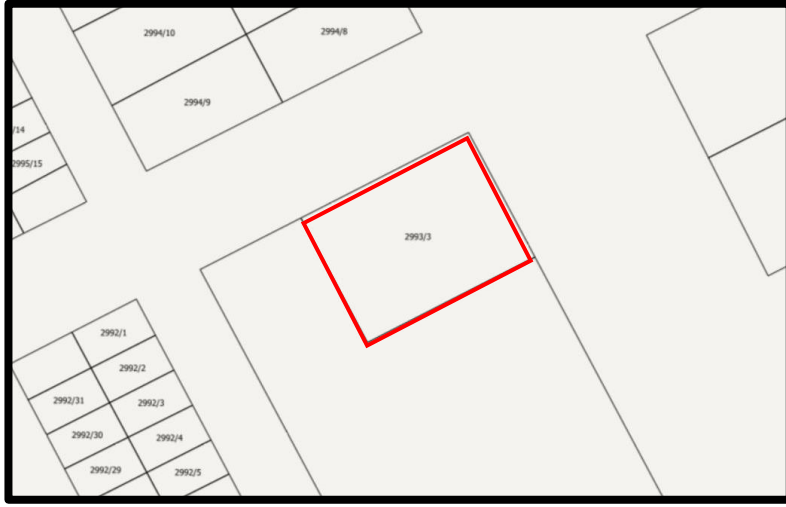
Şekil 4. Planlama Alanına Ait Kadastro Haritası

Planlamaya konu Altyapı ve Kentsel Dönüşüm Hizmetleri Genel Müdürlüğü'ne tahsisli 2993 ada 3 parsel halihazırda boş durumdadır.