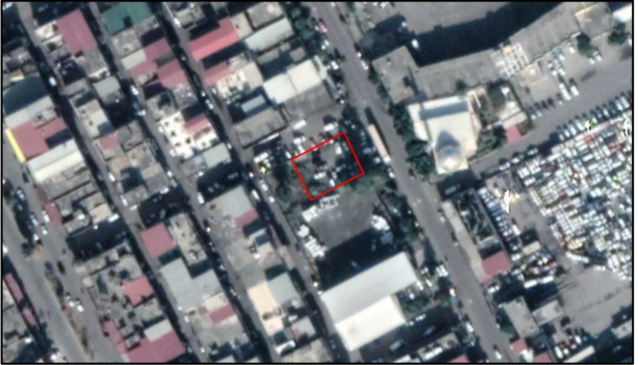
Şekil 3. İmar Planı Değişikliğine Konu Alana Ait Yakın Uydu Görüntüsü