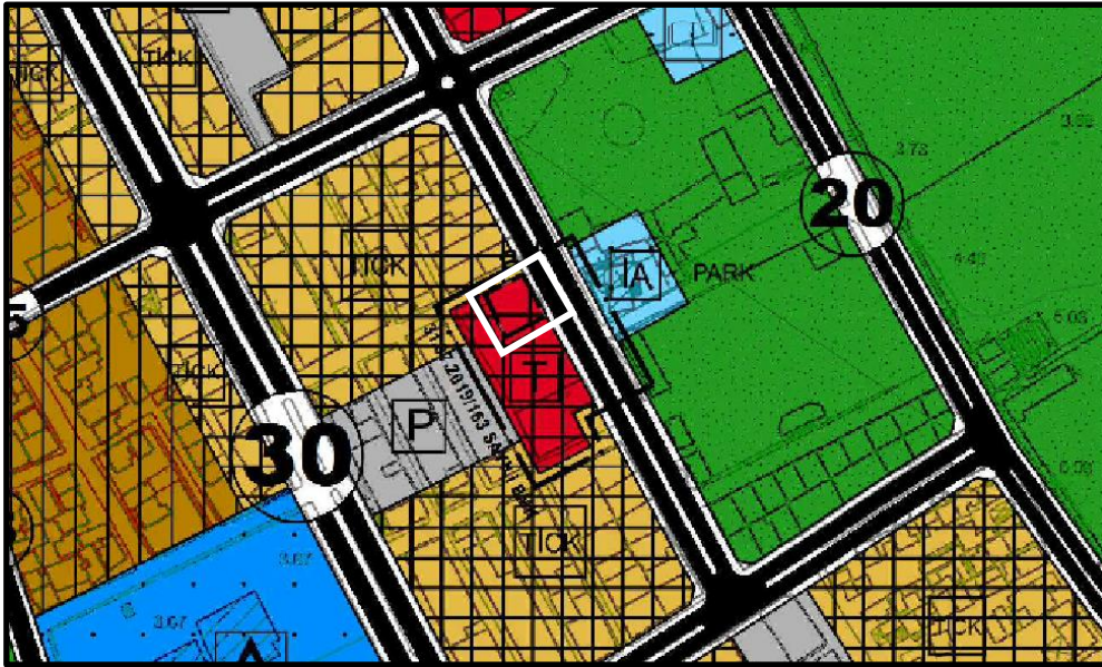
Şekil 7. 1/5000 Ölçekli Uygulama İmar Plan Değişikliği

Diğer yandan plan değişikliği ile kaldırılan "Resmi Kurum" alanı, 14 Haziran 2014 tarih ve 29030 sayılı Resmi Gazetede yayınlanarak yürürlüğe giren "Mekansal Planlar Yapım Yönetmeliği'nin EK-2 Asgari Sosyal ve Teknik Altyapı Alanlarına İlişkin Standartlar ve Asgari Alan Büyüklükleri Tablosunda" nüfusa göre ayrılması gereken donatı alanları kapsamında çıkarıldığı için, yerine yeni bir donatı alanı önerilmemiştir.