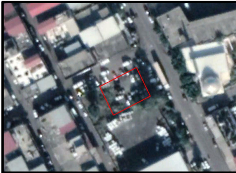
Şekil 5. Planlama Alanının 2020 Uydu Görüntüsü

Planlamaya konu Altyapı ve Kentsel Dönüşüm Hizmetleri Genel Müdürlüğü'ne tahsisli 2993 ada 3 parsel halihazırda boş durumdadır.