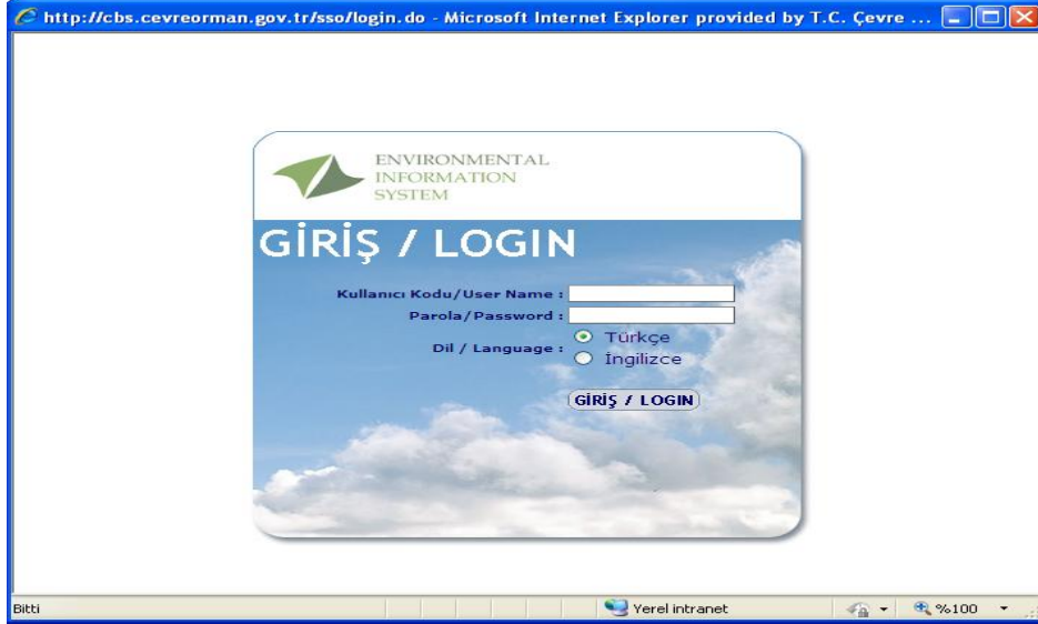
Resim 1– Kayıt giriş formu