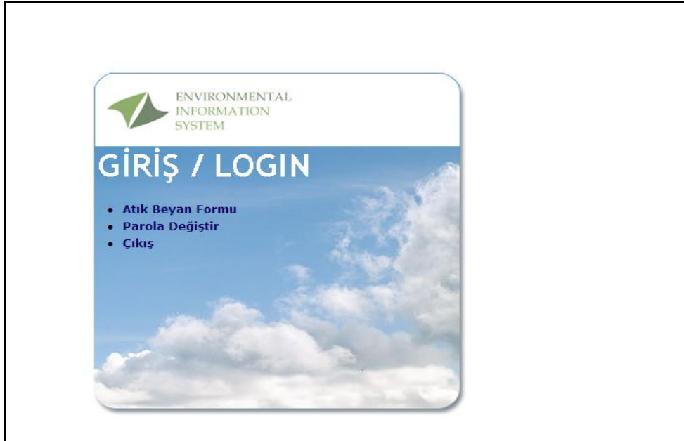
Resim 2- Atık Beyan Formu

Atık Beyan Formu Sekmesini Resim 2 de gösterildiği gibi tıklayınız.