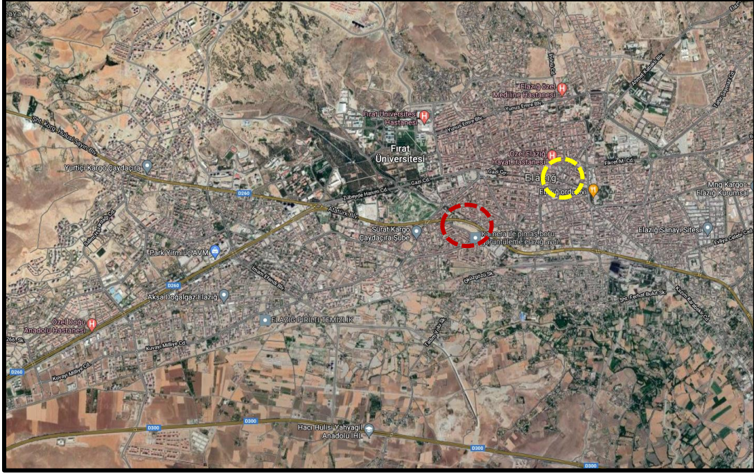
Şekil 2. Plan Değişikliğine Konu Alanın Kent İçerisindeki Konumu

Planlama alanı Elazığ ili, Merkez ilçesi, Kültür Mahallesi sınırları içerisinde yer alan 38 ada 298, 369, 456 ve 462 parseli kapsamaktadır. Ayrıca alan, UTM-3° projeksiyon ve ITRF datumunda tanımlanmış koordinat sisteminde Y: 518,468.056 ve X: 4,281,880.557 yaklaşık koordinatları plan değişikliğine konu alanın merkezini göstermektedir. Planlama alanı ülke pafta indeksinde K42-D-10-D ve K42-D-10-D paftasında kalmaktadır.