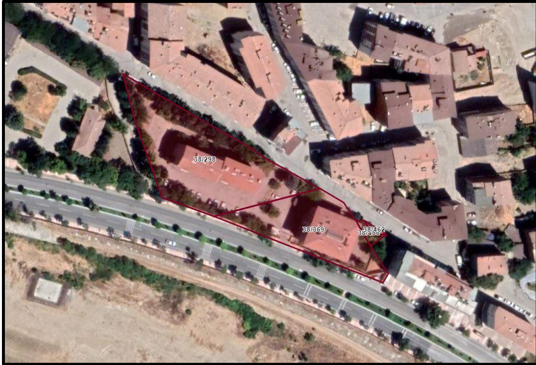
Şekil 3. İmar Planı Değişikliğine Konu Alana Ait Yakın Uydu Görüntüsü