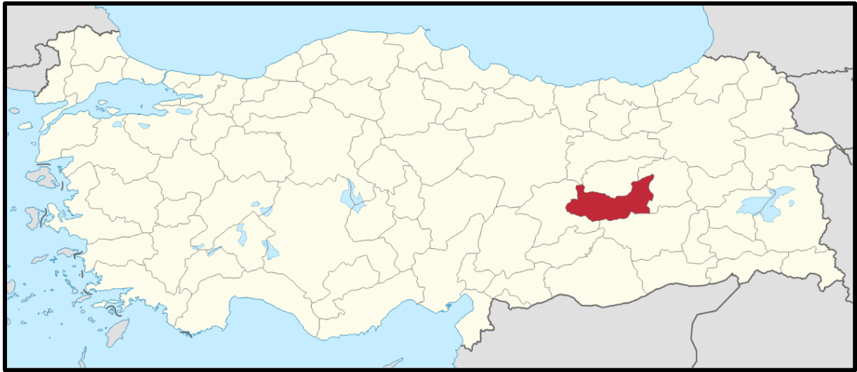
Şekil 1. Elazığ İlinin Ülke İçerisindeki Konumu

Elazığ ili, Anadolu yarımadasında, Doğu Anadolu Bölgesi'nde yer almaktadır. Kuzey sınırını Tunceli ili ve Fırat nehrinin oluşturduğu ilin doğusunda Bingöl, batısında Malatya, güneyinde ise Diyarbakır ili bulunmaktadır. Elazığ ili Merkez ilçesinde bulunan planlama alanı, ilçe merkezine yakın Kültür mahallesi konumunda yer almaktadır. Bölgeyi kuzeyde Kahve sokak, güneyde Atatürk Bulvarı sınırlandırmaktadır. Ulaşım imkanlarının yüksek olduğu bir bölgede konumlanmıştır. İl merkezinin batısında bulunan alan, Atatürk Bulvarı ile kent merkezine bağlanmakta, il merkezine ortalama uzaklığı 1 kilometredir. Taşınmazın yakın çevresinde meskun konut alanı ve park, sosyal tesis, pazar alanı, Elazığ Kültür parkı alanları bulunmaktadır.