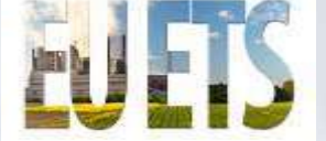
AB ETS Sektörleri (2030)

Karbon kaçağı riski yüksek öncelikli sektörler