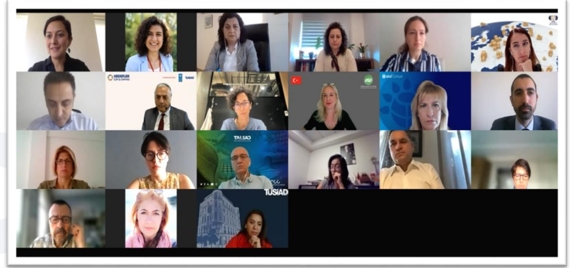
Yeşil ve Döngüsel bir Ekonomi Çalışma Grubu Toplantısı II, 07.09.2021.