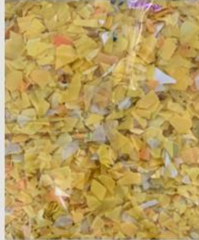
Yıkanmış ve ayrılmış tanecikler