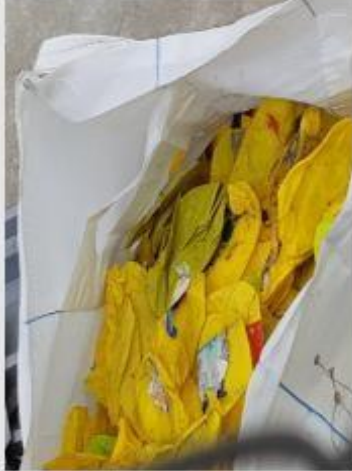
Renklerine ayrılmış şişeler