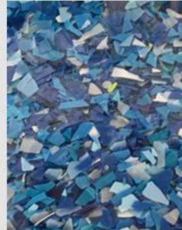
Yıkanmış ve ayrılmış tanecikler