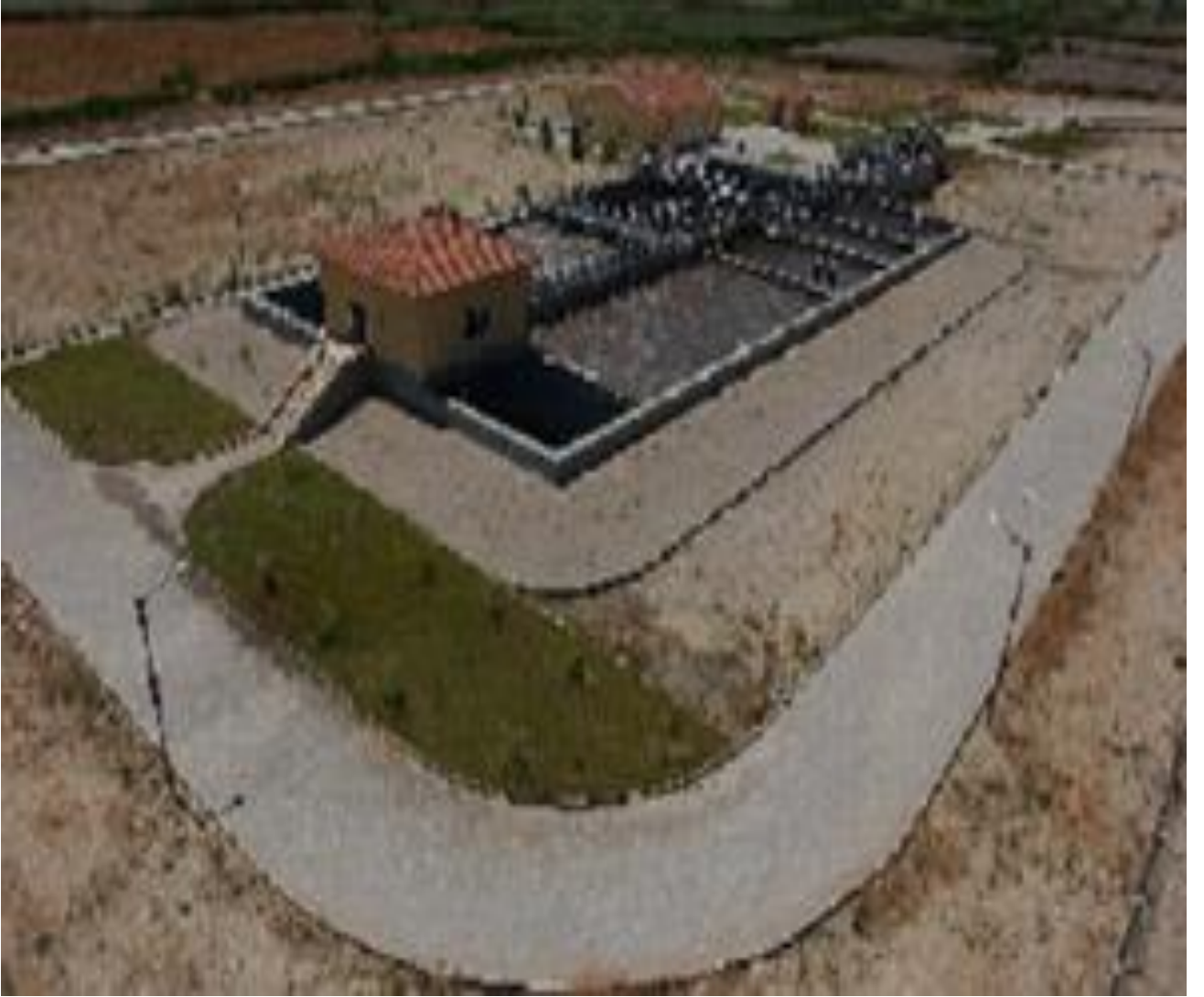
Pamukkale Atıksu Arıtma Tesisi

Pamukkale Kanalizasyon ve Atıksu Arıtma Tesisi: Bölgede yer alan Pamukkale, Karahayit, Akköy, Yeniköy ve Develi köyü yerleşimlerinin evsel atıksularının toplanarak uluslararası standartlarda arıtılıp deşarj edilmesi amacıyla ihale edilmiş olan bu iş kapsamında; toplam 140 km kanalizasyon hattı döşenmiştir. Akköy’de de Atıksu Arıtma Tesisi inşa edilmiştir. Bu Atıksu Arıtma Tesisi 2016 yılı esas alınarak 33.000 kişilik nüfusa göre projelendirilmiştir. Tesis bölgede kurulmuş olan Birliğe işletilmek üzere teslim edilmiştir.