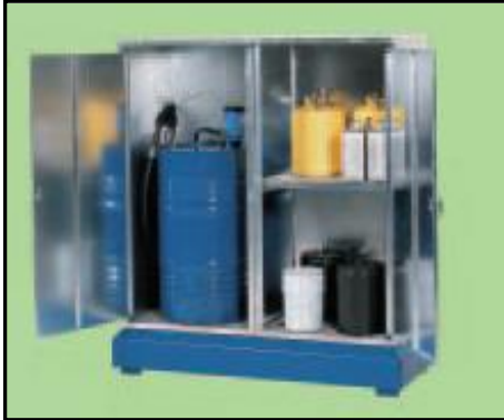
Resim 5.1: örnek taşınabilir depolama kapları

b) Dolumu elle yapılan, küçük miktarlar alan, sabit yada değiştirilebilir plastik ya da metal kap (Tank). Çelik tanklarda yağ yoklama çubuğu, doldurma hunisi ve kilitlenebilen kapak. Şeffaf, plastik tanklarda yağ yoklama çubuğu gerekmez.