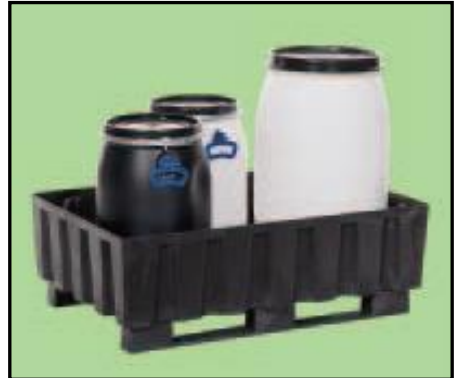
Resim 5.2: örnek taşınabilir depolama kapları