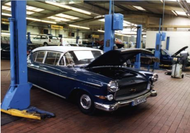
Resim 3.1: Bir oto tamirhanesinden görüntü

En iyi atıklar önlenmiş atıklardır ve atıkların birçoğu basit ve hiç ya da çok az maliyetli fakat bertaraf giderlerini azaltacak tedbirlerle önlenabilir. Bu yüzden bu rehber doküman önemli teknik ipuçlarının yanısıra çabuk ve fazla emek gerektirmeden uygulanabilecek tedbirlere odaklanmıştır.