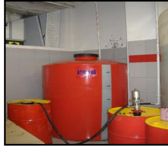
Resim 5.4: Örnek sabit bağlantılı depolama tankı