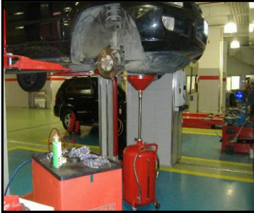
Resim 5.3: Örnek sabit bağlantılı toplama kapları