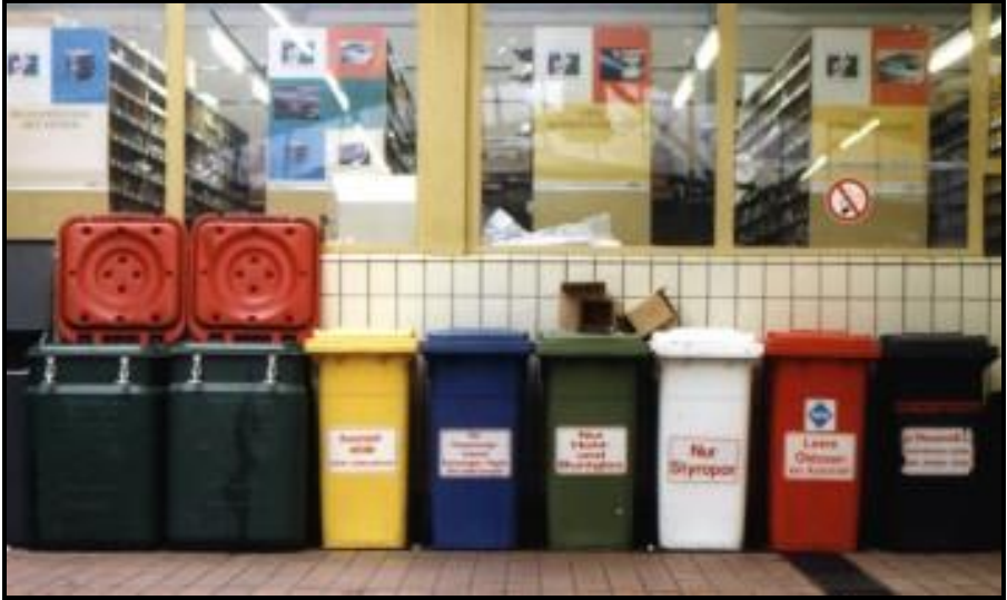
Resim 4.1: Oto tamirhanelerinde maliyeti azaltmak amacıyla yapılan ayrı toplama örneği

Bunların dışında örneğin otomobil boyama, motor ayarı yapımı ya da karoser yapımı gibi özel işlemlerden dolayı boya atıkları, soğutucu yağ ya da metal talaşları gibi ilave tehlikeli atıklar da çıkabilir.