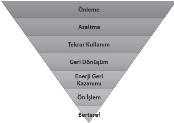
Şekil 3. Atık yönetim hiyerarşisi

Atık Yönetimi Yönetmeliği incelendiğinde atık hiyerarşisinin altının çizildiği görülmektedir. Şekil 3 'de şematik olarak gösterilen bu anlayışa göre öncelikle atıkların oluşumunun önlenmesi gerekmektedir. Eğer atık oluşumu önlenemiyorsa üretilen miktarların mümkün olduğu kadar aza indirgenmesi esastır. Atıkların önlenemediği ya da miktar olarak azaltılmadığı durumda atıkların yeniden değerlendirilebilmeleri için geri dönüşüm ya da yeni kullanılabilir ürünler elde edilmesi amacıyla geri kazanım fırsatları aranmalıdır. Geri dönüşüm/ geri kazanım uygulamaları bir alternatif değilse atıklar ön işlem tesisleri ya da yakma fırınlarında işlem görmelidir. Bu aşamadaki en önemli hedef işlenen tehlikeli atık hacminin ya da miktarının işlem sonunda düşürülmesidir. Bu sayede en az tercih edilen alternatif olan nihai bertarafa gidecek atık miktarı azaltılacaktır. Atık hiyerarşisi prensibine atıklar ancak daha tercih edilebilir alternatifler işe yaramadığı durumda nihai bertarafa gönderilmelidir.