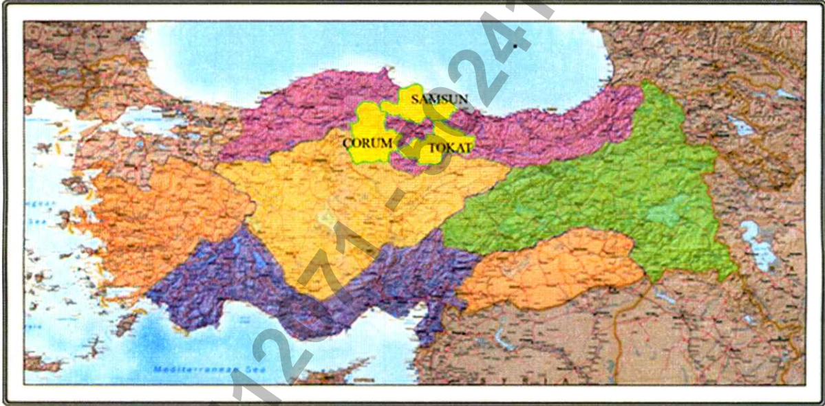
Şekil 1: Samsun-Çorum-Tokat Planlama Bölgesi

Samsun-Çorum-Tokat Planlama Bölgesi 1/100.000 Ölçekli Çevre Düzeni Planı Samsun, Çorum, Tokat il sınırları içinde, planın amacına yönelik mekânsal kararlar, politika ve stratejileri içermektedir. İllerin yönetsel sınırları bu planın onay sınırlarıdır. Planlama Bölgesi toplam 37.762 km 2 'lik bir alanı kapsamaktadır.