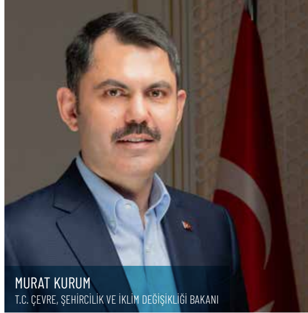
MURAT KURUM T.C. ÇEVRE, ŞEHİRCİLİK VE İKLİM DEĞİŞİKLİĞİ BAKANI