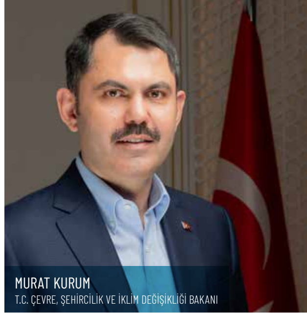
MURAT KURUM T.C. ÇEVRE, ŞEHİRCİLİK VE İKLİM DEĞİŞİKLİĞİ BAKANI

TOKİ'DEN ELAZIĞ'A 11 MİLYAR LİRALIK YATIRIM / 4 3 BİN 277 KONUT İNŞAATI DEVAM EDİYOR / 5 İLBANK'TAN ELAZIĞ'A 344 MİLYON LİRALIK DESTEK / 5 KENT-KÖY MİLLET BAHÇESİ'NİN AÇILIŞI YAPILDI / 7 KARAKOÇAN'A 42 BİN 448 METREKARELİK MİLLET BAHÇESİ YAPILDI / 8 KOVANCILAR İLÇESİNE MİLLET BAHÇESİ YAPILDI / 9 ŞEHİT MEHMET KAYA ÇELİK MİLLET BAHÇESİ YAPILDI / 10 ARICAK İLÇESİNE MİLLET BAHÇESİ MÜJDESİ / 10 ÇAKIRKAŞ MESİRE ALANI MİLLET BAHÇESİ YAPILIYOR / 11 YEMİŞLİK MAHALLESİ'NE 2. ETAPTA 560 KONUT / 12 ABDULLAHPAŞA MAHALLESİ'NE 1. ETAPTA 141 KONUT YAPILDI / 12 ABDULLAHPAŞA MAHALLESİ'NE 2. ETAPTA 977 KONUT YAPILDI / 12 ABDULLAHPAŞA MAHALLESİ'NE 3. ETAPTA 617 KONUT YAPILDI / 13 ABDULLAHPAŞA MAHALLESİ'NE 4. ETAPTA 516 KONUT YAPILDI / 13 YEMİŞLİK MAHALLESİ'NE 2. ETAPTA 560 KONUT / 14 AKÇAKIRAZ MAHALLESİ'NE 111 KONUT YAPILDI / 14 AKSARAY MAHALLESİ'NE 72 MİLYON LİRALIK YATIRIM / 15 ARICAK VE PALU İLÇELERİNE EĞİTİM BİNASI / 15 AŞAĞI HOLPENK MAHALLESİ 4. ETAPTA 577 KONUT YAPILIYOR / 16 AŞAĞI HOLPENK MAHALLESİ'NE 587 KONUT / 16 BASKİL VE MADEN İLÇESİNE KÖYEVİ VE AHIR YAPILDI / 17 BİZMİŞEN MAHALLESİ'NE 781 KONUT / 17 ÇATALÇEŞME MAHALLESİ 3. ETAPTA 528 KONUT / 18 ÇATALÇEŞME MAHALLESİ'NE 4. ETAPTA 462 KONUT / 19 ÇATALÇEŞME MAHALLESİ'NE 5. ETAPTA 281 KONUT / 19 ÇATALÇEŞME MAHALLESİ 2. ETAPTA 924 KONUT / 20 ÇATALÇEŞME MAHALLESİ'NE 24 DERSLİKLİ EĞİTİM BİNASI / 20 GEZİN MAHALLESİ'NE 122 KONUT YAPILDI / 21