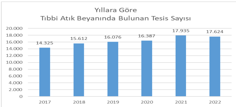
Grafik 2. Yıllara Göre Tıbbi Atık Beyanında Bulunan Tesis Sayısı (Adet)

2022 yılında 17.624 adet tesis Atık Yönetim Uygulaması üzerinden Atık Beyan Sistemi (TABS) kullanarak atık beyanında bulunmuştur.