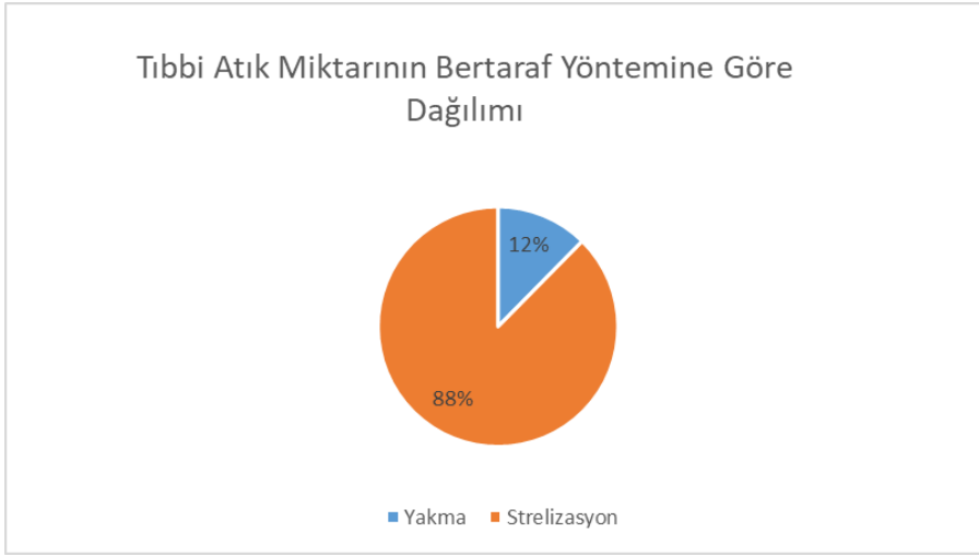
Grafik 3. 2022 yılı Tıbbi Atık Miktarının Bertaraf Yöntemine Göre Dağılımı

2022 yılında beyan edilen tıbbi atık miktarının %88'i bertaraf edilmek üzere sterilizasyon tesislerine, %12'si ise yakma tesislerine gönderilmiştir.