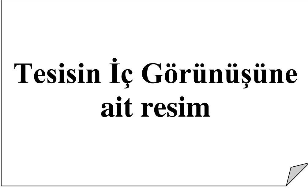
Resim 2.3 Makine ve Ekipman 3