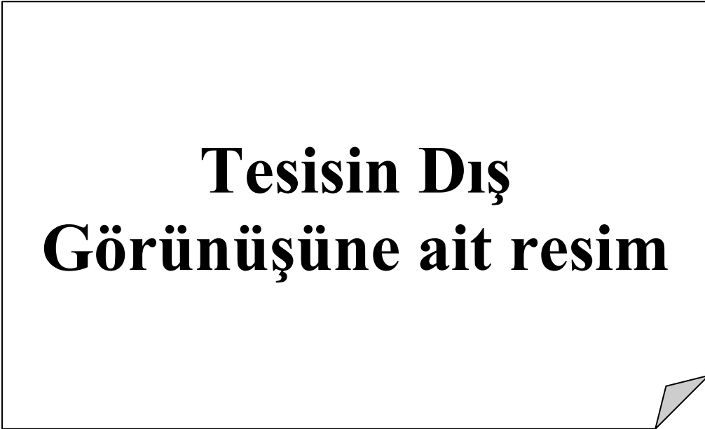
Resim 1.2 Tesisin Dış Görünüşü 2