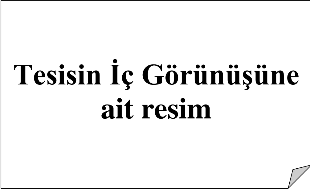
Resim 2.4 Makine ve Ekipman 4