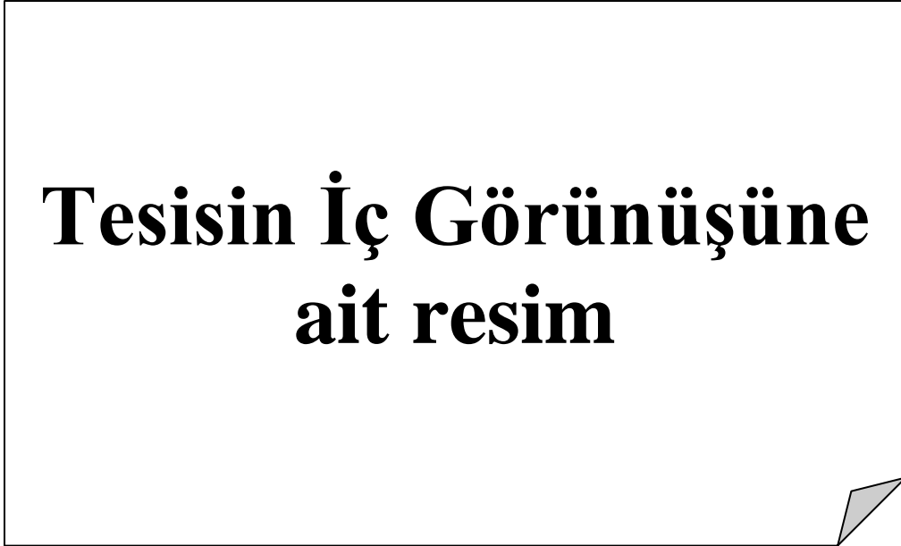
Resim 1.4 Tesisin İç Görünüşü 2

4.2. Ünite, Makine ve Ekipmanlar (bu bölüme en az 4 fotoğraf eklenerek makinelerin genel yerleşimleri gösterilmelidir.)