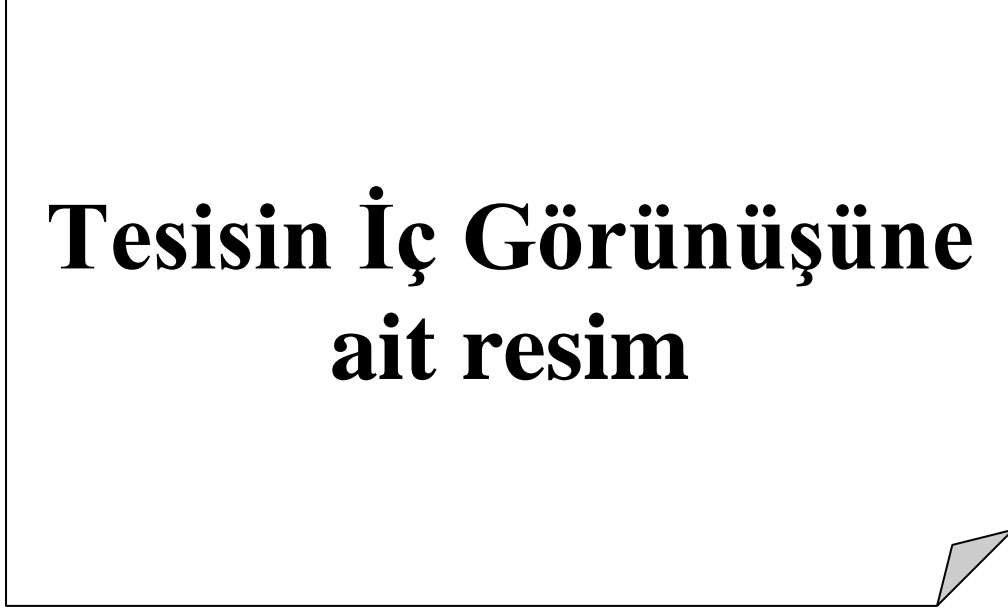
Resim 1.3 Tesisin İç Görünüşü 1