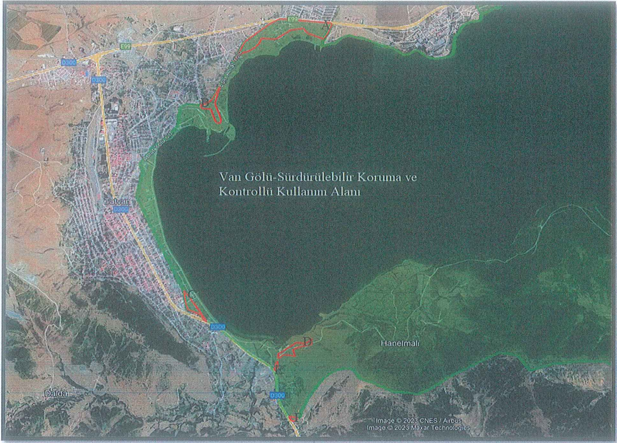
Geçiş Dönemi Koruma Esasları ve Kullanma Şartları Belirlenen Alan Sınırı (Sürdürülebilir Koruma ve Kontrollü Kullanım Alanı)

Handwritten blue ink marks: a vertical line, a stylized 'M' or 'W' shape, and a cross-like symbol.