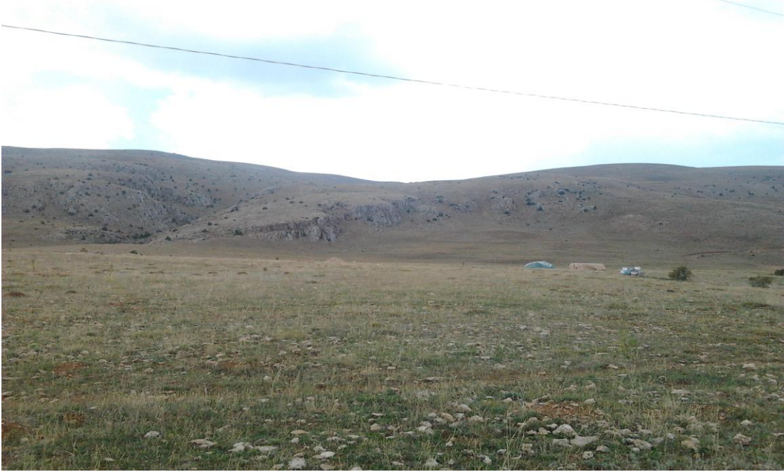
İskan Konutlarının yapılmasının düşünüldüğü arsanın görünümü

Yaylapınar köyünde yapılan hak sahipliği çalışmaları sonucunda 43 aile hak sahibi olarak kabul edilmiştir. Köy muhtarlığınca iskan konutlarının yapılması düşünülen alan belirlenerek müdürlüğümüze bildirilmiş bildirilen alanla ilgili olarak kurum görüşleri alınarak yer seçim protokolü düzenlenerek Bakanlığımıza gönderilmiştir. İskan Konutlarının yapılacağı arsanın hali hazır harita çalışmaları tamamlanarak Milli Emlak Müdürlüğünden arsanın tahsis yazışmaları yapılmış ve jeolojik- Jeoteknik etüt raporları hazırlanması aşamasına gelinmiştir.