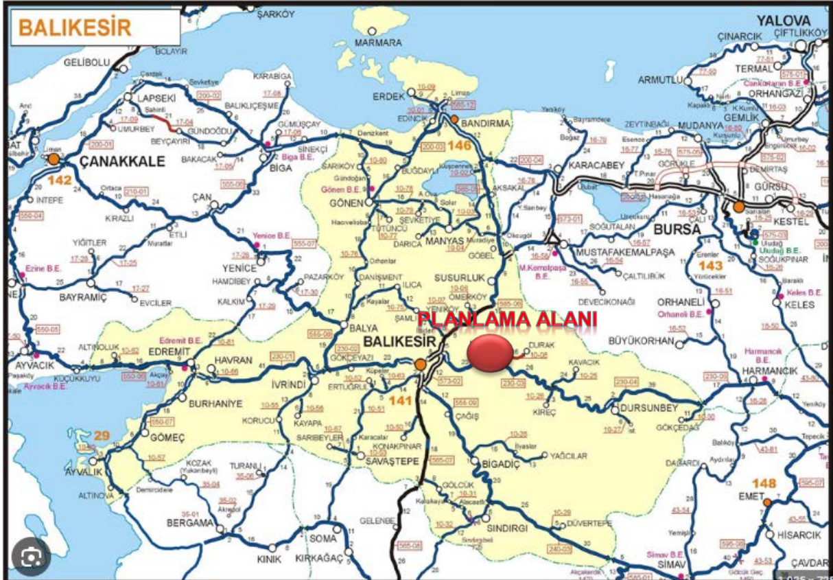
Harita 1,Proje Alanının Ege Bölgesindeki Yeri

Planlama alanı Türkiye'nin Marmara bölgesi sınırlarında yer almakta olup, Planlama alanının kuzeyinde Balıkesir iline bağlı Susurluk ilçesi, güneyinde Kepsut İlçesi,