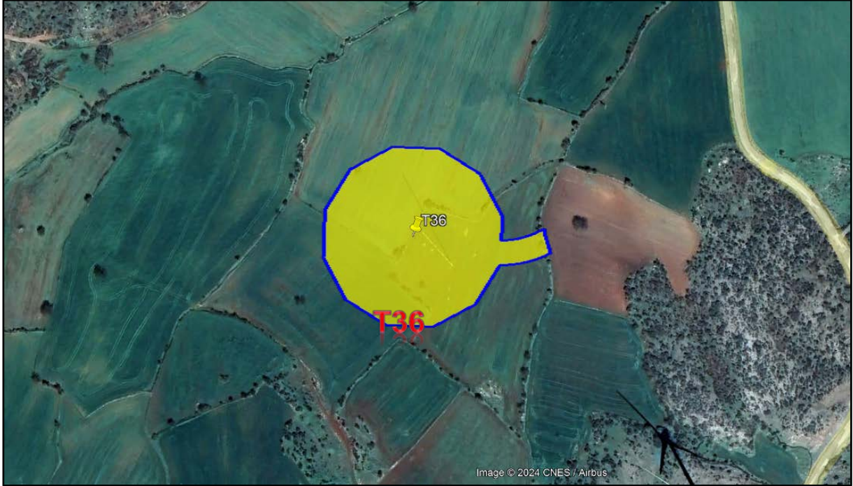
Harita 2,Planlama Alanının Uydu Görüntüsü

Son olarak Poyraz Yenilenebilir Enerji Üretim A.Ş. tarafından yapılması planlanan Poyraz RES projesi kapsamında T36 nolu Türbinin Uydu görüntüsü aşağıdaki görselde yer almaktadır.