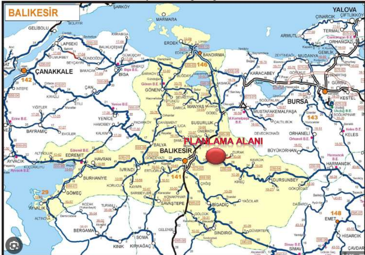
Harita 1,Proje Alanının Ege Bölgesindeki Yeri

Planlama alanı Türkiye'nin Marmara bölgesi sınırlarında yer almakta olup, Planlama alanının kuzeyinde Balıkesir iline bağlı Susurluk ilçesi, güneyinde Kepsut İlçesi,