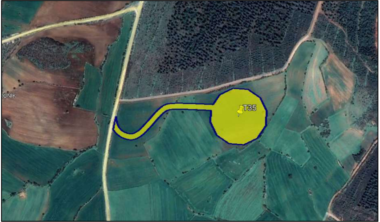
Harita 2,Planlama Alanının Uydu Görüntüsü

Son olarak Poyraz Yenilenebilir Enerji Üretim A.Ş. tarafından yapılması planlanan Poyraz RES projesi kapsamında T35 nolu Türbinin Uydu görüntüsü aşağıdaki görselde yer almaktadır.