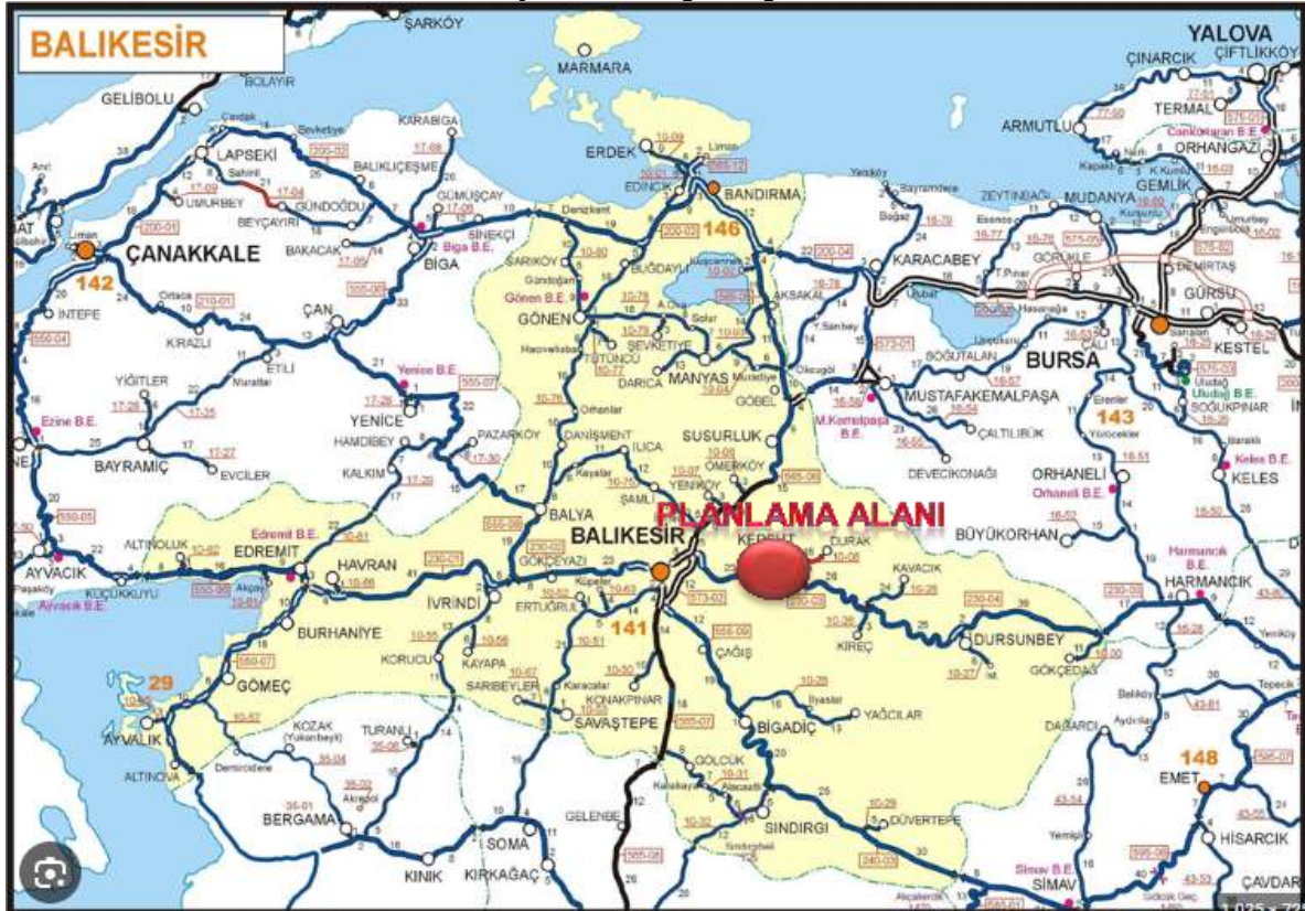
Harita 1,Proje Alanının Ege Bölgesindeki Yeri

Planlama alanı Türkiye'nin Marmara bölgesi sınırlarında yer almakta olup, Planlama alanının kuzeyinde Balıkesir iline bağlı Susurluk ilçesi, güneyinde Kepsut İlçesi,