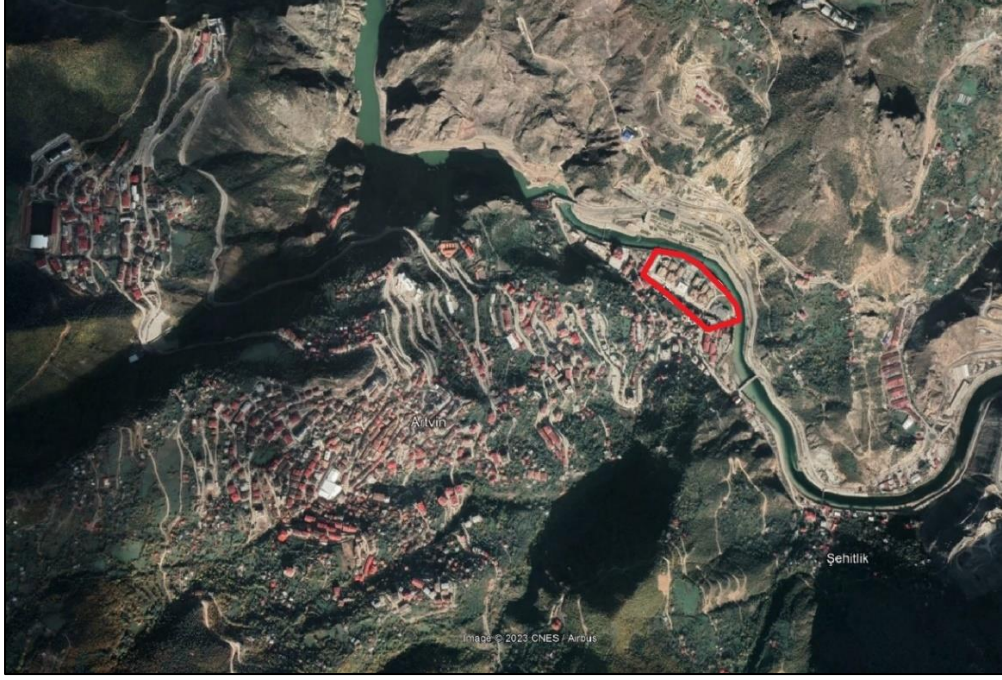
Şekil 1: Plan değişikliğine konu alanın konumu

Plan değişikliğine konu alan Artvin İli, Merkez ilçesi, Çayağzı Mahallesi 163 ada 54 parseli kapsamaktadır.