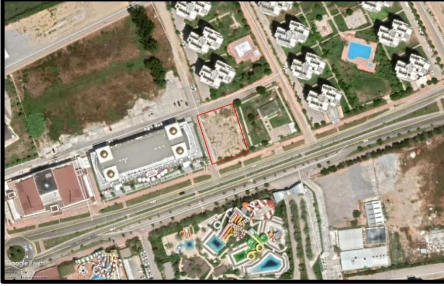
Şekil 4. İmar Planına Konu Alan ve Yakın Çevresi

Planlamaya konu 11073 ada 1 parsel mevcutta arazi kullanımı bulunmamaktadır. Parsel Lara Turizm yolu üzerinde bulunmakta olup batısında alışveriş merkezleri ve doğusunda Polis Merkezi yer almaktadır.