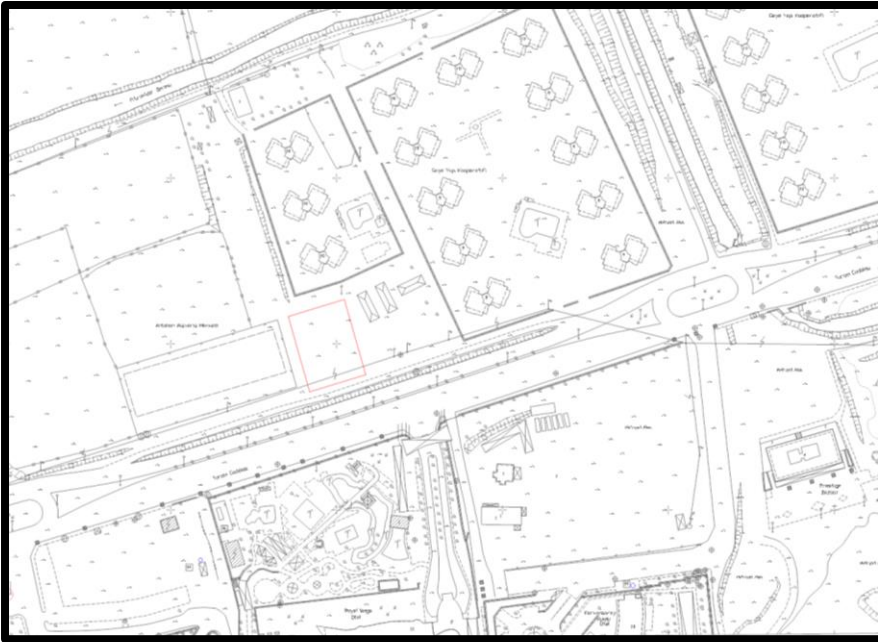
Şekil 5. Planlama Alanının Halihazır ve Mülkiyet Durumu

Planlamaya konu 11073 ada 1 parsel Aksu ilçesi Kemerağzı mahallesi sınırları içerisinde yer almaktadır. Halihazır haritada mevcut parsel içerisinde yapı veya kullanım bulunmamaktadır. 11073 ada 1 parsel büyüklüğü 1.668,65 m 2 olup planlamaya konu alan parsel sınırına göre belirlenmiştir. Planlamaya konu alanın toplam büyüklüğü 1.668,65 m 2 m 2 'dir. 11073 ada 1 nolu parselin mülkiyeti Maliye Hazinesine aittir.