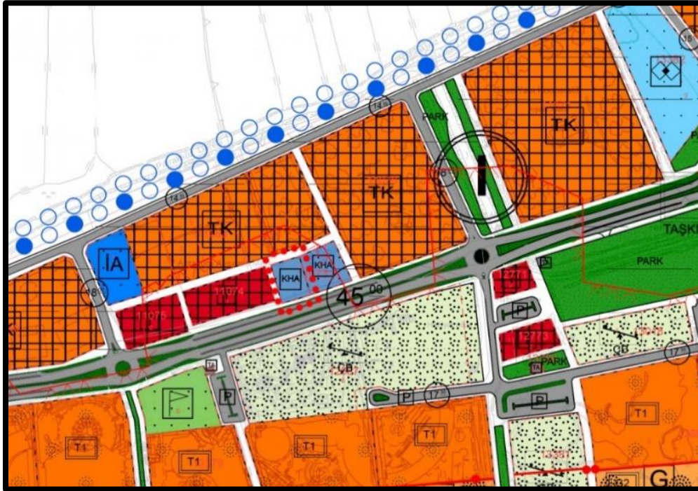
Şekil 6. İptal Edilen 1/5000 Ölçekli Nazım İmar Planı

Plan sınırının da içerisinde kaldığı Antalya ili, Kemeragzı-Kundu Kültür ve Turizm Koruma ve Gelişim Bölgesi 1. Etap Kültür ve Turizm Bakanlığının 29.03.2018 tarih 2018/03-32 sayılı kararı ile onaylanan 1/5000 ölçekli Nazım İmar Planı Antalya 1.İdari Mahkemesinin 2018/865 esas nolu dosyasında görülen davada; Mahkemenin 01.10.2019 gün ve K: 2019/1012 sayılı kararı ile “...halkın kıyıda ki kamusal alana erişim sorunu ve Anayasa ve Kıyı kanununa aykırı olduğu...” gerekçeleriyle planın iptaline karar verilmiştir. Planlamaya konu alanın meri 1/5000 ölçekli Nazım İmar Planı bulunmamaktadır.