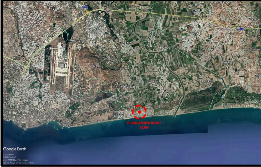
Şekil 2. Planlama Alanının Kent İçerisindeki Konumu

Planlama alanı Antalya ili, Aksu ilçesine bağlı Kemeragzı Mahallesi sınırları içerisinde yer alan 11073 ada 1 parseli kapsamaktadır. Ayrıca alan, UTM-3° projeksiyon ve ITRF-96 datumunda tanımlanmış koordinat sisteminde Y: 578794.820 ve X: 4081098.937 yaklaşık koordinatları planlamaya konu alanın merkezini göstermektedir. Planlama alanı ülke pafta indeksinde O25-B-13-C-4-B paftasında kalmaktadır.