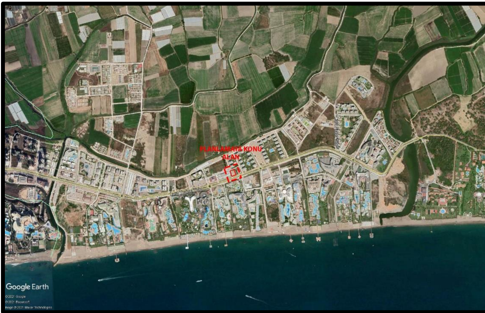
Şekil 3. İmar Planına Konu Alana Ait Yakın Uydu Görüntüsü