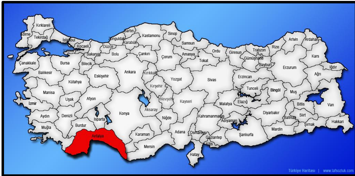
Şekil 1. Antalya İlinin Ülke İçerisindeki Konumu

Planlama konu Aksu ilçesi Antalya il merkezinin 10 km doğusunda yer almaktadır. 11073 ada 1 parsel Antalya il merkezinin doğusunda Kemeragzı mahallesi sınırları içerisinde Lara Turizm yolu üzerinde yer almaktadır.