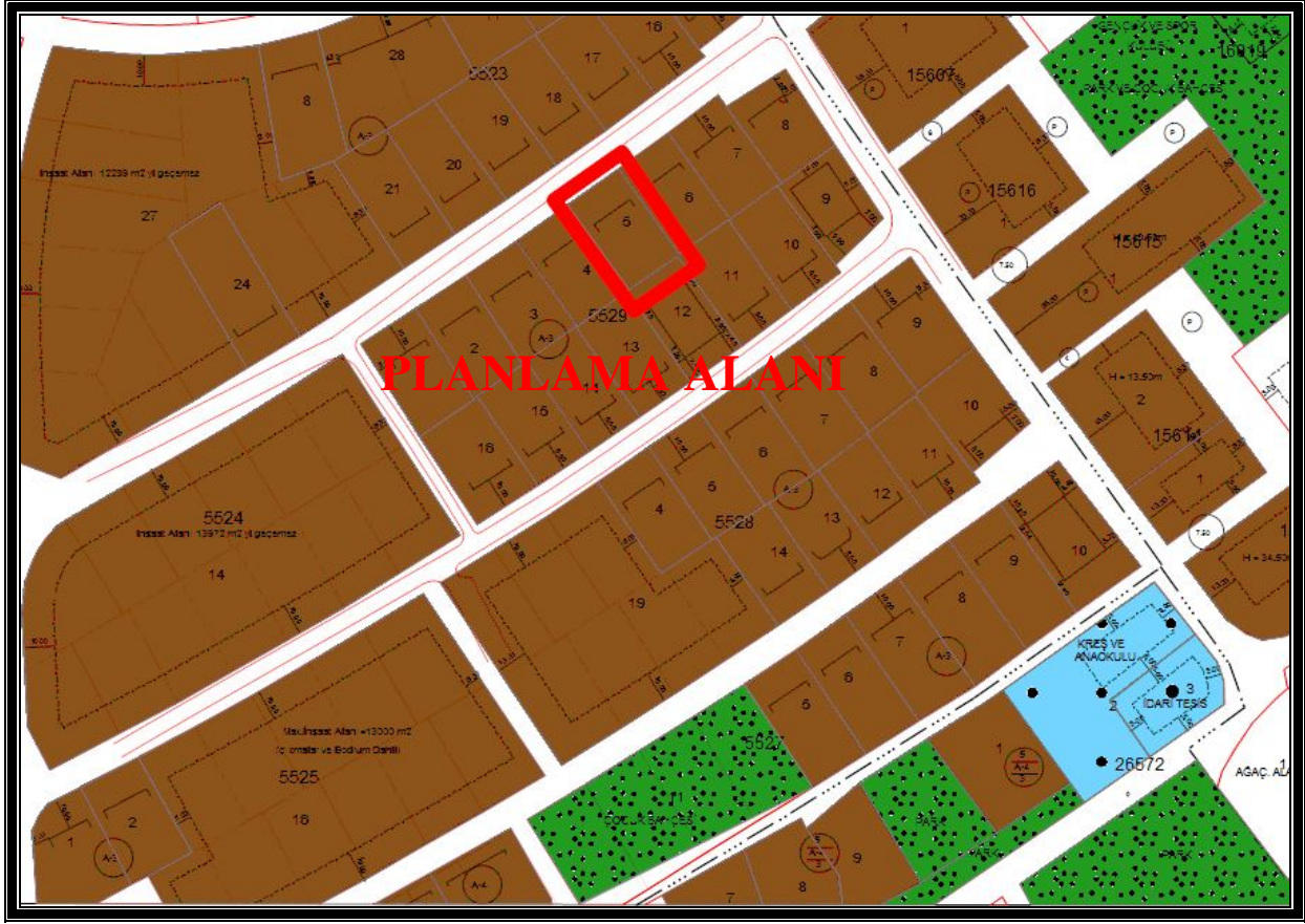
Resim 3. Onaylı İmar Planı Durumu