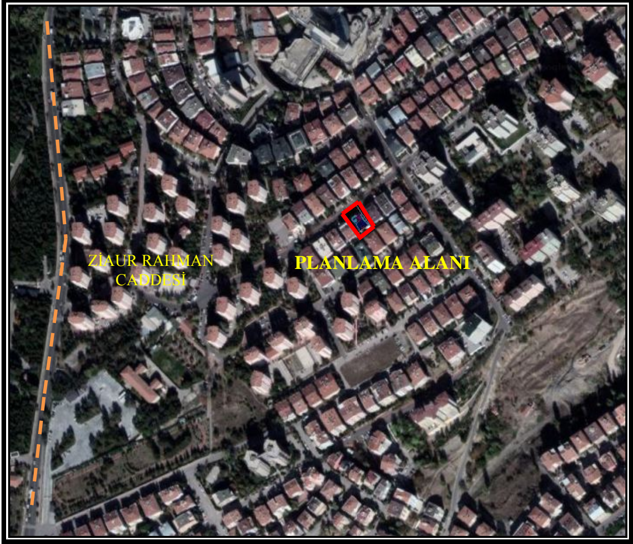
Resim 1: Planlama Alanı Uydu Fotoğrafi