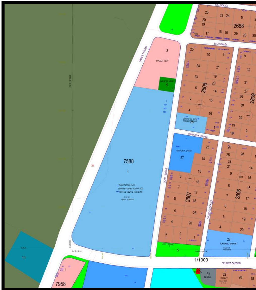
Şekil 2: Mevcut Uygulama İmar Planı

Dikmen Mahallesi 7588 Ada 1 Parsele ilişkin 07.05.2014 tarihinde 7169 sayılı kararla onaylanmış 1/1000 Ölçekli Uygulama İmar Planı bulunmaktadır. Söz konusu planda 7588 Ada 1 Parsel Resmi Kurum (Emniyet Genel Müdürlüğü İdari ve Sosyal Tesis Alanı) olarak belirlenmiştir. Resmi Kurum Alanında yapılaşma koşulları E: 2.00 ve Yençok: Serbest olarak belirlenmiştir.