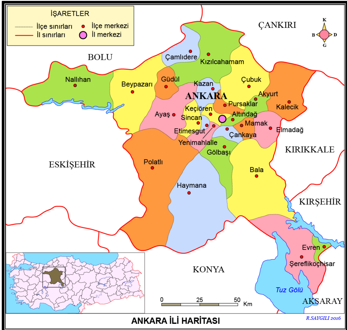
Harita 2 : Ankara İli İdari Bölünüşü