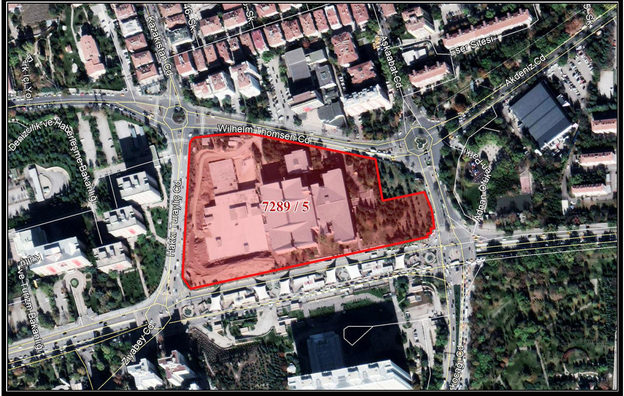
Harita 3 : Planlama Alanının Konumunu Gösteren Uydu Görüntüsü

Planlama alanı güneyinde İsmet İnönü Bulvarı (Eskişehir Yolu), kuzeyinde Wilhelm Thomsen Caddesi, doğusunda Aşkaabat Caddesi ve batısında Hakkı Turaylıç Caddesi yer almaktadır.