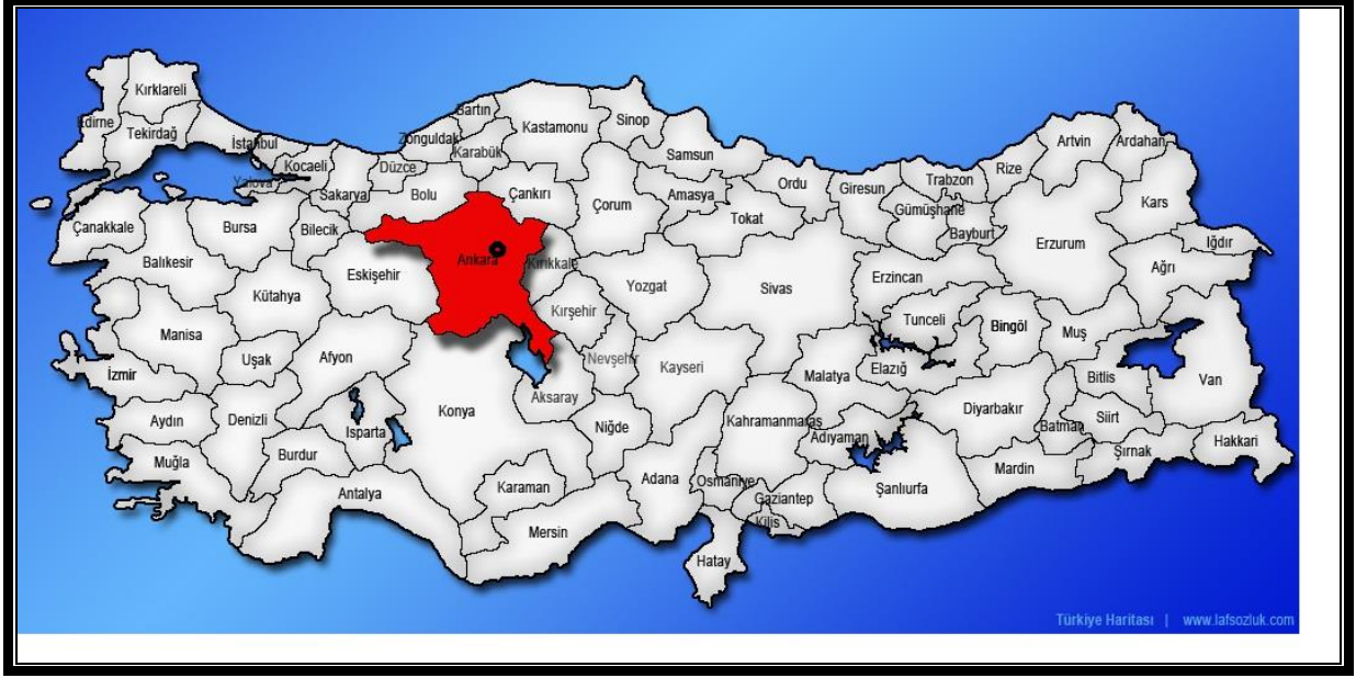
Harita 1 : Ankara İli ve Çankaya İlçesinin Ülke ve Bölge İçindeki Yeri

Ankara İlinin 2016 yılı Tuik verilerine göre toplam 5.346.518 kişilik nüfusu ile Türkiye nüfusunun % 6,69 'lık bölümünü barındırmaktadır. (Tuik,2016)