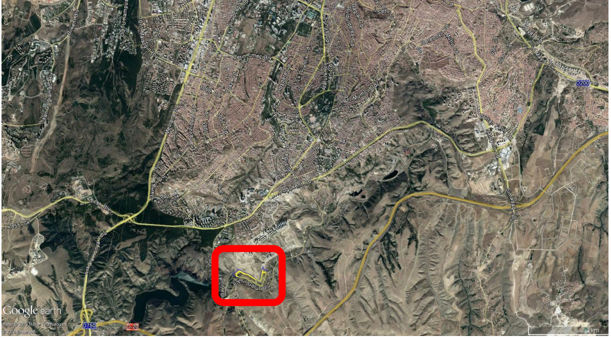
Şekil 1. Planlama Alanı Genel Konumu

Planlama alanın kuzeydoğusunda yer alan sırt bölgesinde Sinpaş konutları, batısında Eymir gölü yer almaktadır. Planlama alanı düz bir yapıya sahiptir.