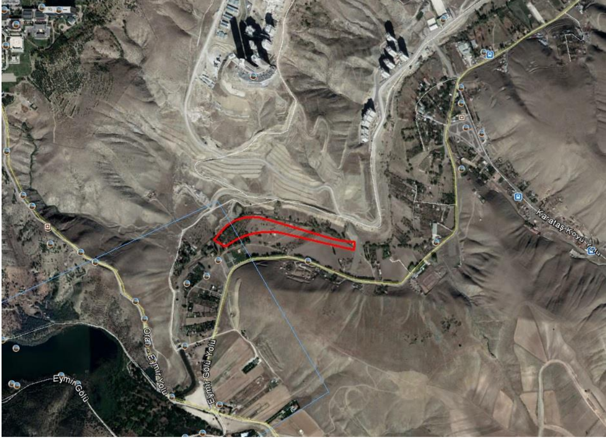
Şekil 2. Planlama Alanı

Planlama alanı, Bakanlar Kurulu'nun 18.4.1996 tarih ve 96/8109 sayılı kararı ile yürürlüğe giren Türkiye Deprem Bölgeleri haritasında 4. Deprem Bölgesinde yer almaktadır.