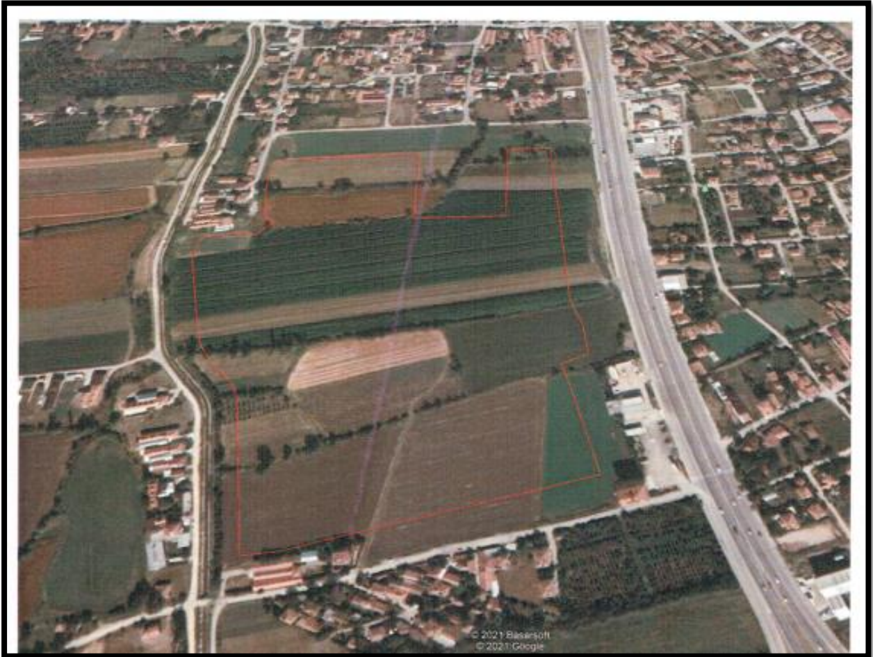
Şekil 4: Alanın Uydu Görüntüsü üzerindeki sınırları