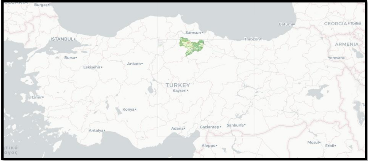
Şekil 1: Amasya İli 1/100.000 Ölçekli Çevre Düzeni Planı

Amasya İli 1/100.000 Ölçekli Çevre Düzeni Planı Amasya il sınırları içinde, planın amacına yönelik mekânsal kararlar, politika ve stratejileri içermektedir.