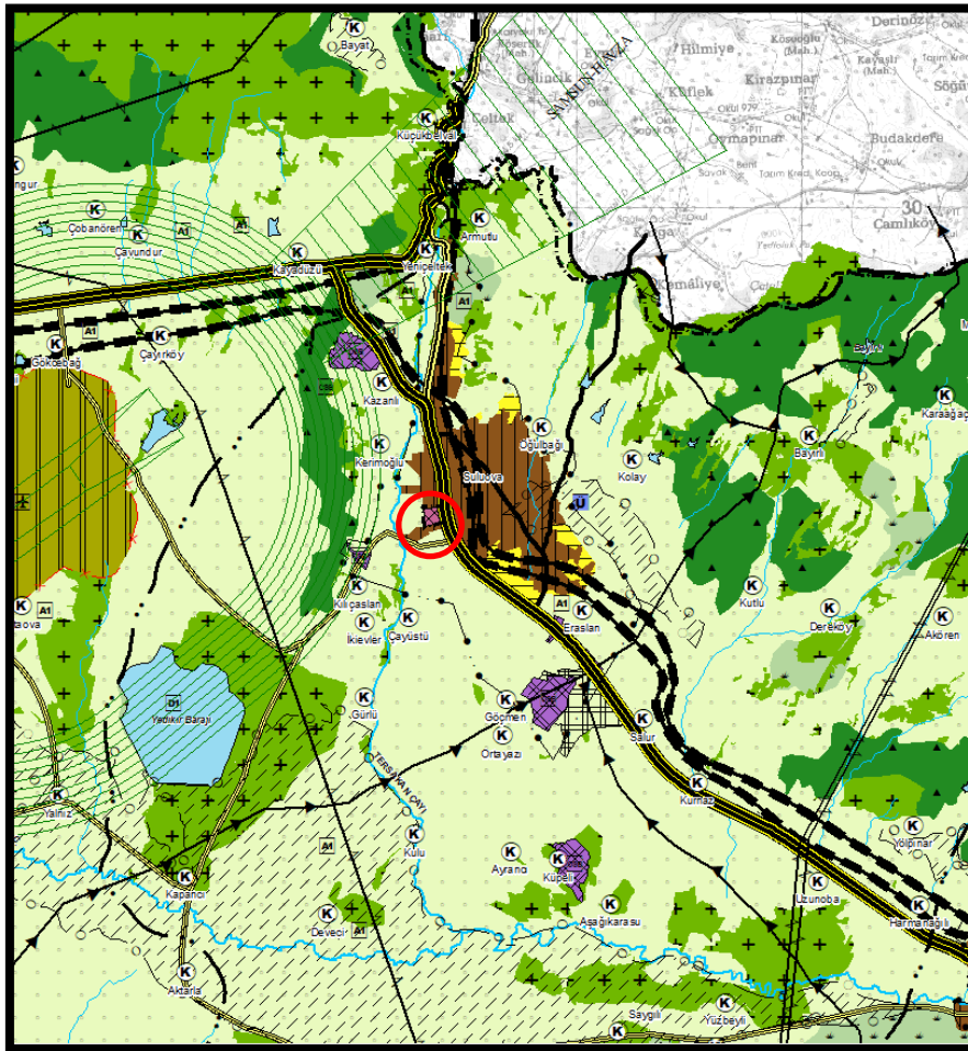
ÇDP'NİN DEĞİŞİKLİKTEN SONRAKİ HALİ

hususları ile birlikte 5403 sayılı Toprak Koruma ve Arazi Kullanım Kanununun 13. Maddesi (d) bendi kapsamında İlave İmar amaçlı Tarım Dışı Kullanım izninin alındığı göz önünde bulundurularak alt ölçekli planlama çalışmalarını yönlendirmek amacıyla ÇDP'de "Tarım Alanı" olarak tanımlı yaklaşık 16 Ha alanın Çevre Düzeni Planının gösterim tekniğine uygun olarak Amasya İli 1/100.000 Ölçekli Çevre Düzeni Planında (G-35 Paftası) Belediye hizmet alanı, kamu hizmet alanı, konut dışı kentsel çalışma alanı, toplu işyerleri ve küçük sanayi sitesi alanlarının yer alabileceği "Kentsel Servis Alanı" olarak düzenlenmesi uygun değerlendirilmiştir.