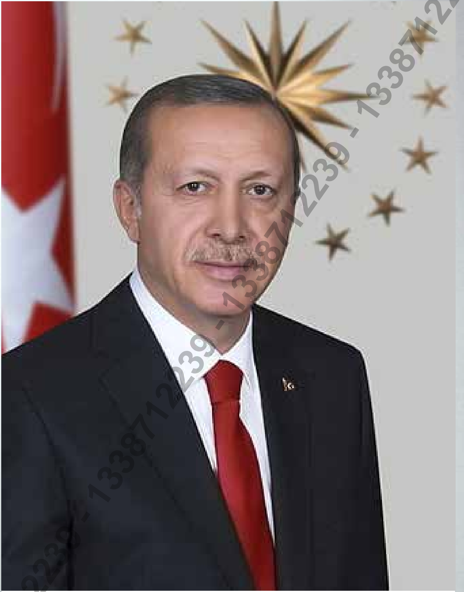
RECEP TAYYİP ERDOĞAN Türkiye Cumhuriyeti Cumhurbaşkanı