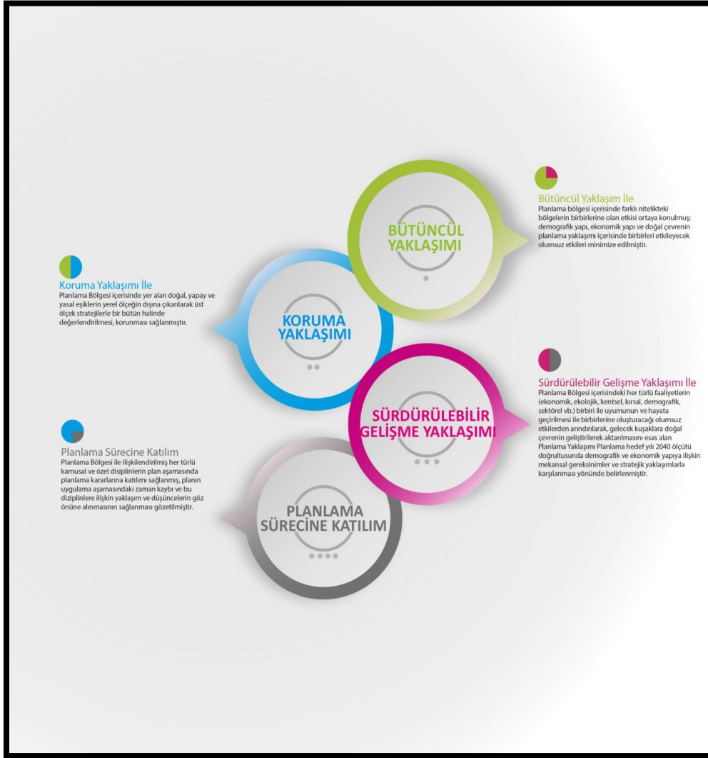
ŞEKİL 2 : BALIKESİR ÇANAKKALE PLANLAMA BÖLGESİ 1/100000 ÖLÇEKLİ ÇEVRE DÜZENİ PLANI PLANLAMA YAKLAŞIMLARI

Balıkesir Çanakkale Planlama Bölgesi 1/100000 Ölçekli Çevre Düzeni Planı genel yaklaşımını dört başlık altında toplanmaktadır. Bunlar; Bütünlük Yaklaşımı, Koruma Yaklaşımı, Sürdürülebilir Gelişme Yaklaşımı ve Planlama Sürecine Katılımın Sağlanmasıdır.