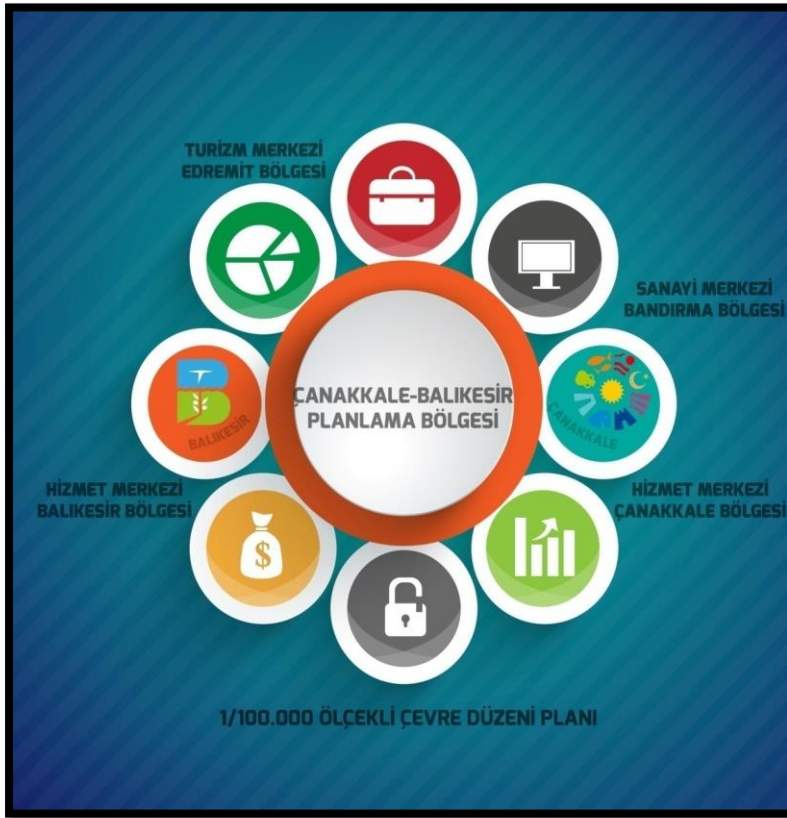
ŞEKİL 1 : BALIKESİR ÇANAKKALE PLANLAMA BÖLGESİ 1/100000 ÖLÇEKLİ ÇEVRE DÜZENİ PLANI BÖLGELEMELERİ

Planlama Bölgesi için kabul edilen senaryo çerçevesinde ve Planı yönlendiren bölgesel strateji ve planlama yaklaşımlarına uygun olarak 4 ana sektörel gelişim bölgesi belirlenmiştir. Bu planlama bölgeleri;