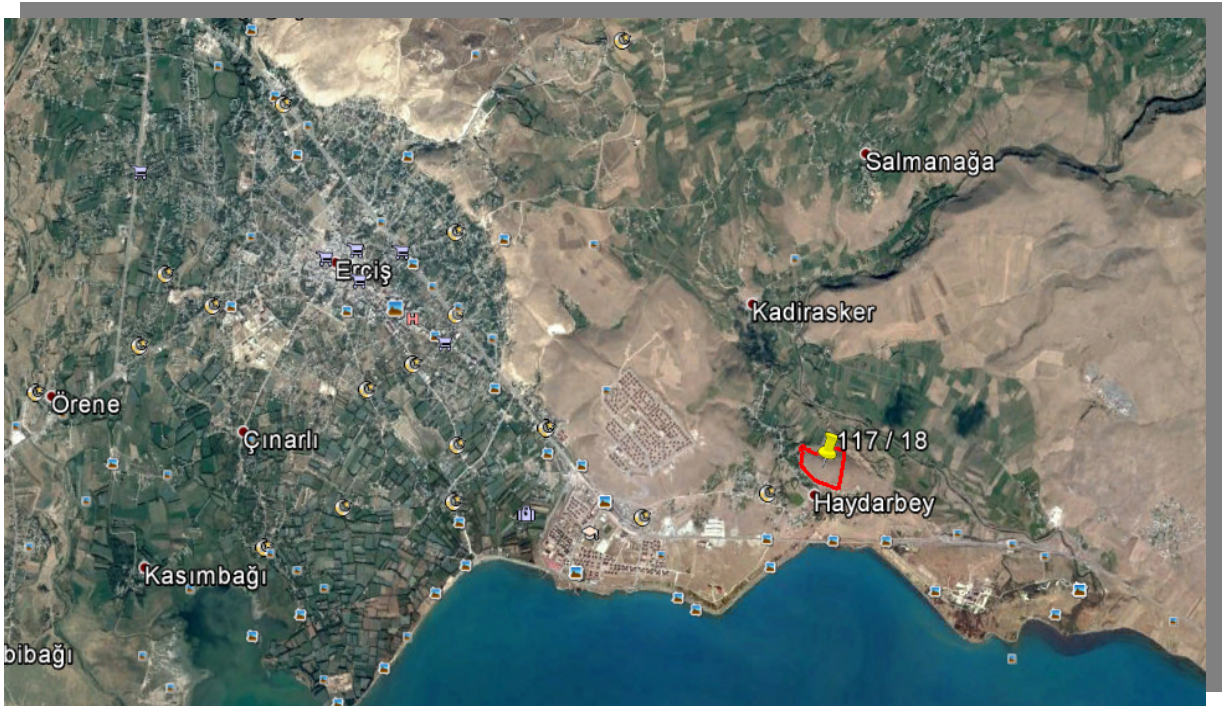
Resim 1 : Planlama Alanı

Planlama alanı dikey 4320600 - 4321200, yatay 623700 - 624300 koordinatları arasında yer almaktadır. Erciş ilçe merkezine yaklaşık 8 km mesafede tepelik alanın zirve noktasındadır. Tepede yer alması nedeniyle özellikle güney ve güneybatı cephede dik bölgeler bulunmaktadır. Mevcut durumda taşınmaza doğu tarafta yer alan kadastral yol ile ulaşılmaktadır.