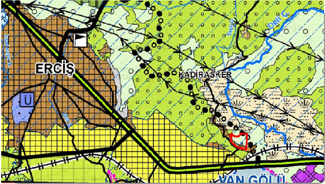
Resim 2 : Muş-Bitlis-Van Planlama Bölgesi 1/100.000 Çevre Düzeni Planı'nda Planlama Alanı Sınırı