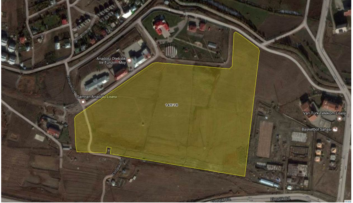
Harita 1: 149 Ada 18 No'lu parselin uydu fotoğrafı üzerinde parsel sınırları

koordinatları arasında kalan 149 ada 18 parselde kalan yaklaşık 15,4 hektarlık (155.144,15m 2 ) bir alanı kapsamaktadır.