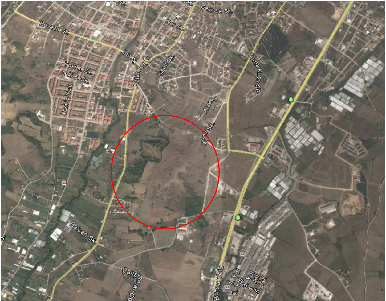
Şehir Hastanesi Yapılması Planlanan Alan