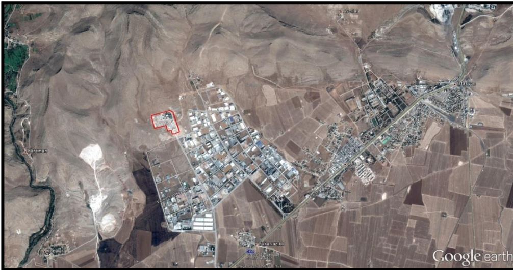
Planlama Alanının Konumu

Planlama alanı, Mardin İli Artuklu İlçesi Avcılar Mahallesi sınırları içinde bulunmakta olup, Mardin OSB'nin kuzeyinde yer almaktadır.