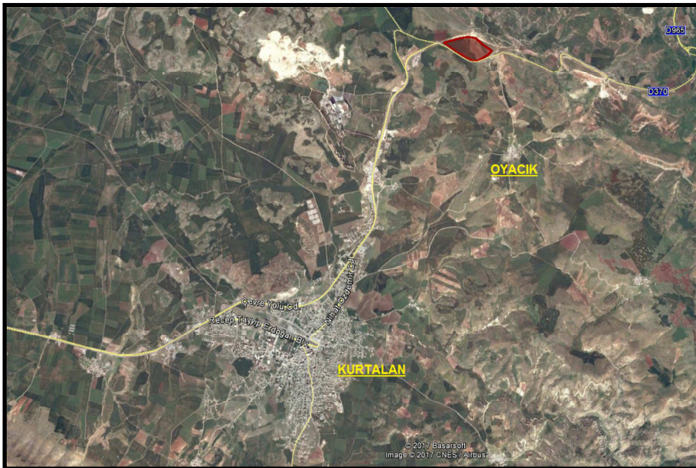
Planlama Alanının Konumu

Planlama alanı ise; Kurtalan İlçesi, Oyacık Köyü sınırları içerisinde Batman-Siirt karayolu üzerinde, Kurtalan İlçesine yaklaşık olarak 5.5 – 6 km mesafededir.