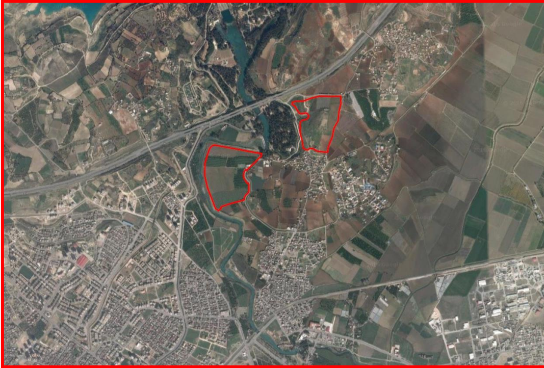
Şekil 1: Planlama Alanının Uydu Görüntüsü

Planlamaya konu alan; Türkiye'nin Akdeniz Bölgesinde, Mersin İli, Tarsus İlçesinin kuzeyinde 36°57'00" kuzey enlemleri ve 34°53'46" doğu boylamları arasında yer almaktadır. Söz konusu alan UTM-3 ED-50 (Dilim Orta Boylamı 36) projeksiyon sisteminde yatayda (Y):669532-668410, düşeyde (X):4091657-4090655 koordinatları arasında kalmakta olup yaklaşık büyüklüğü 33.98 ha.'dır. Alanda mevcutta yapılaşma bulunmamaktadır.