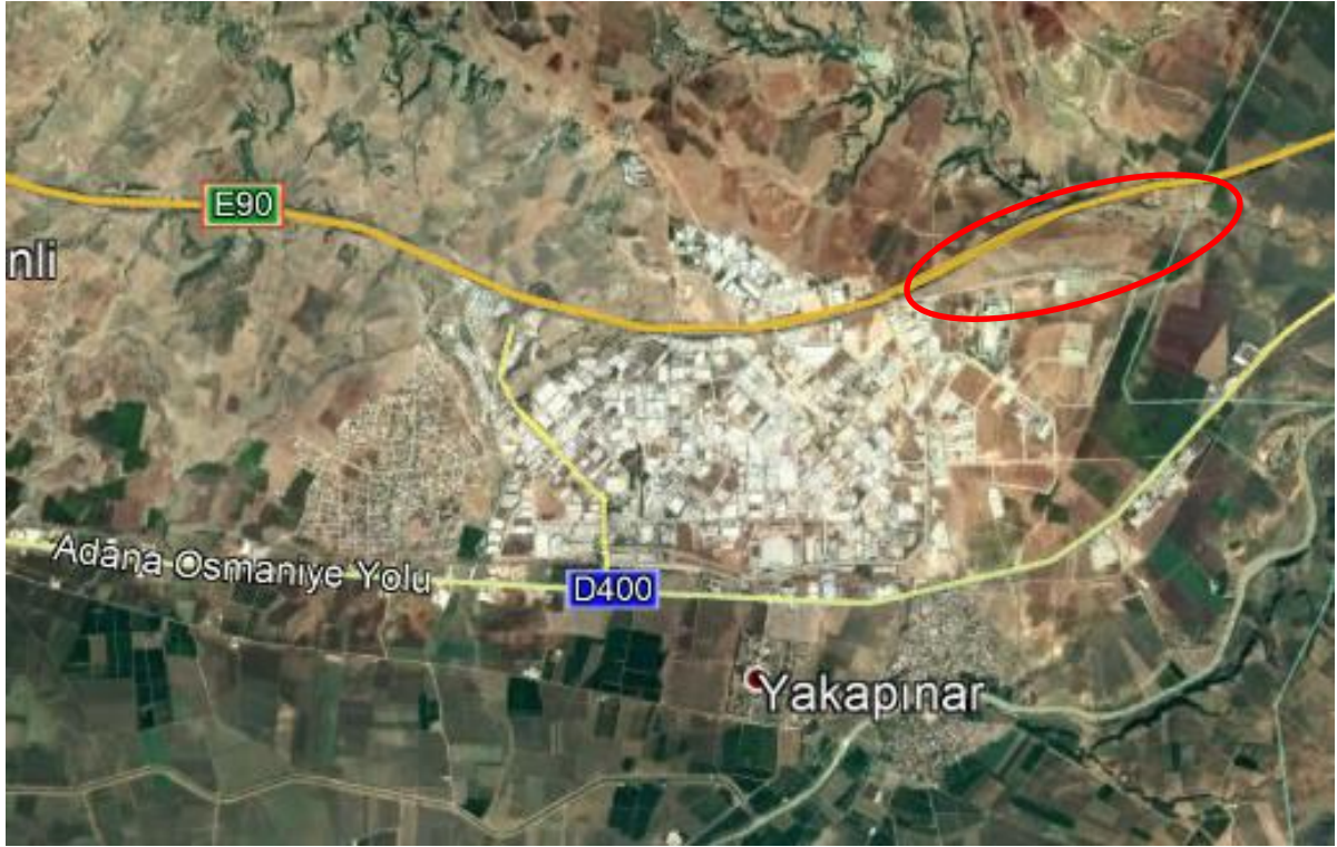
Şekil 1. Planlama Alanının Konumu (Uydu Görüntüsü)

Planlama alanının bir kısmında 1. ve 3. Derece Arkeolojik Sit Alanları bulunmakta olup Bilim, Sanayi ve Teknoloji Bakanlığı'nın 02/10/2017 tarihli ve 37419779-453.01/TR/01E.3944 sayılı yer seçimi kesinleştirme yazısında, 4. İlave OSB sınırlarının 1. Derece Arkeolojik Sit Alanı sınırı haricinde tutulduğu, bu kapsamda 4. İlave OSB alanının yaklaşık 99,35 ha. alanı kapsadığı belirtilmektedir.