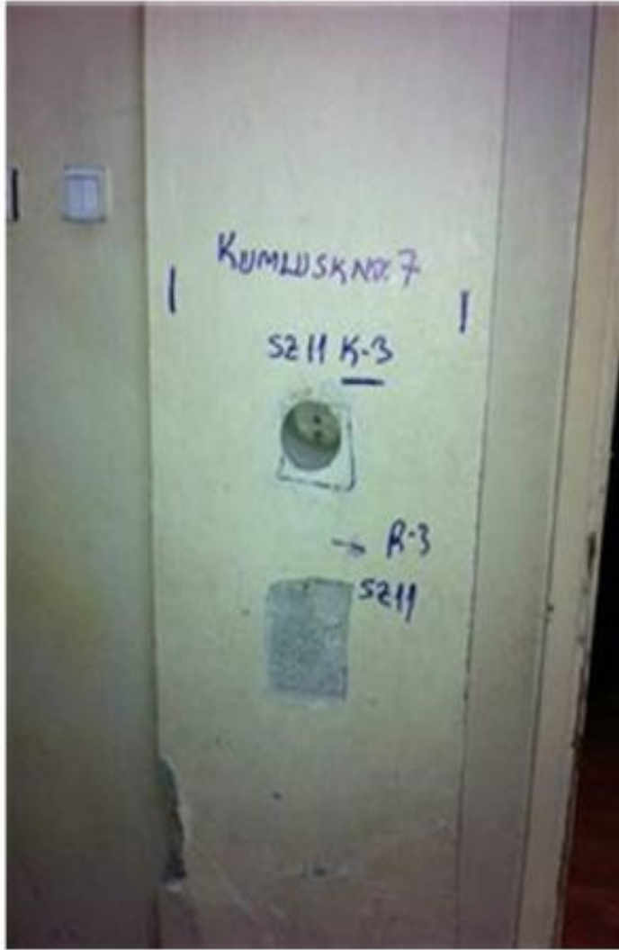
Zemin Kat SZ11 Kolonu K3 Karotu