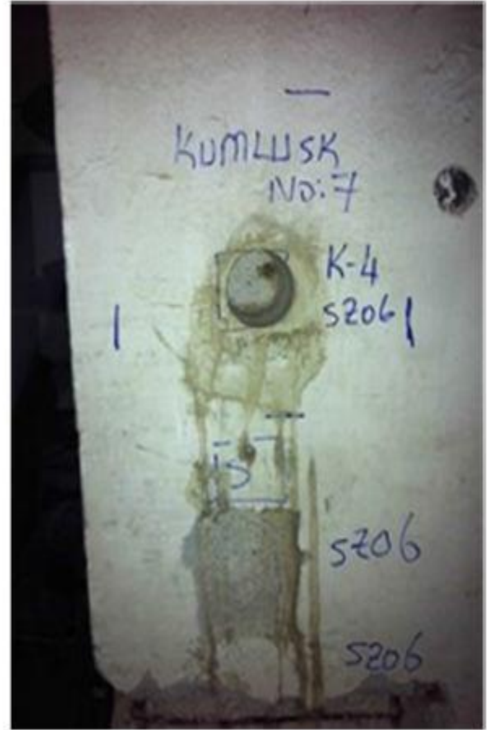
Zemin Kat SZ06 Kolonu K4 Karotu