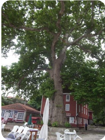
Kastamonu Çevre ve Şehircilik İl Müdürlüğü