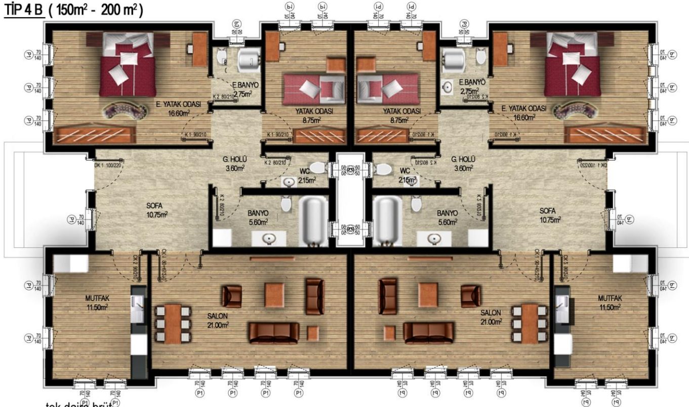
TİP 4 B ( 150m 2 - 200 m 2 )