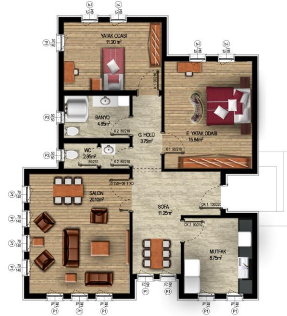
ZEMİN KAT PLANI A:91.15 m 2