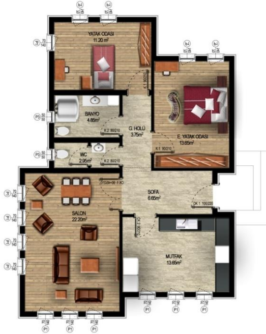
ZEMİN KAT PLANI A:91.00 m 2